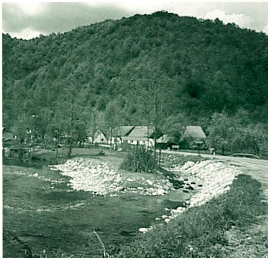
Že dalj časa je Kolpa spodjedala brežino v Boslji Loki. Sedaj so pričeli brežino urejati, kamnita ograda je prav lična.