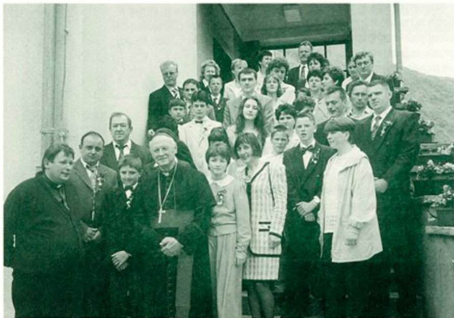
Po končani birmi so se birmanci fotografirali skupaj s svojimi botri in starši.