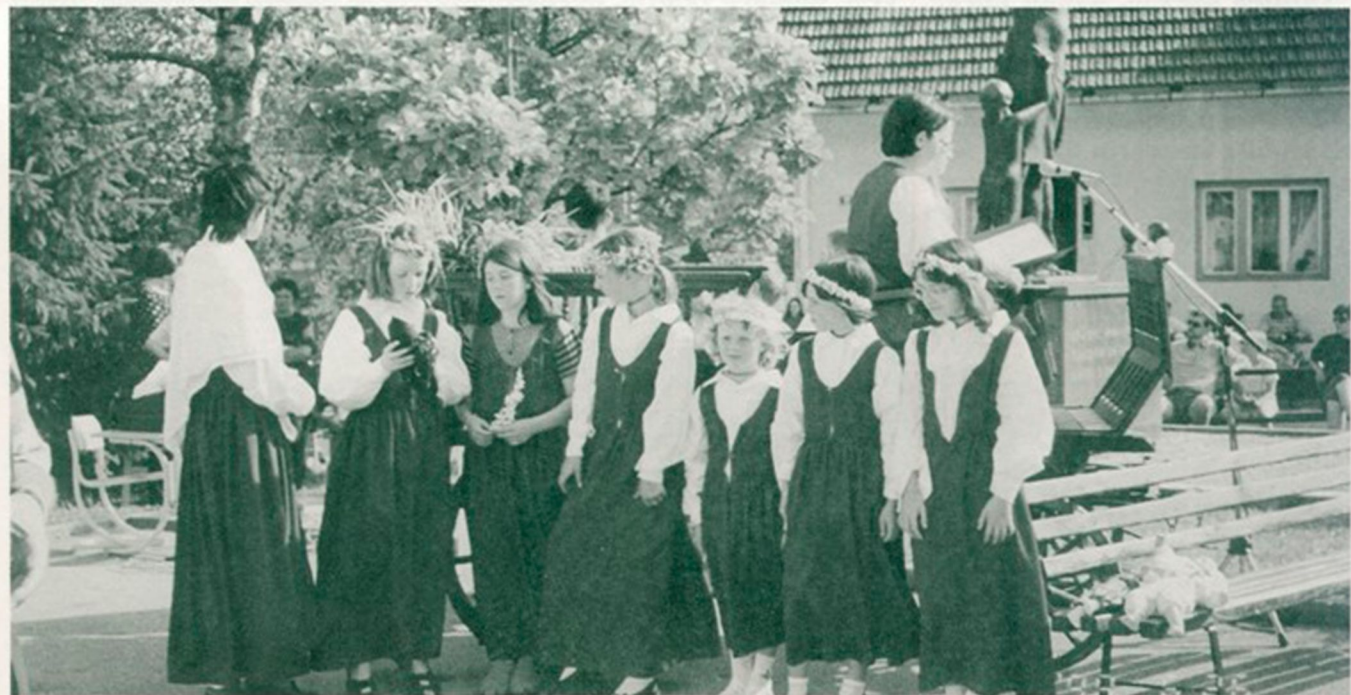
Vsako leto se na Petruvem predstavijo tudi kresničke.

Bliža se naš, Osilniški praznik, Petruvu. tokrat ga bomo praznovali v soboto, 1. julija. Prireditvev se bo pričela ob 16.30. uri z mašo. Ob 18. uri se bo pričel kulturni program, nadaljevali pa bomo z zabavnim.