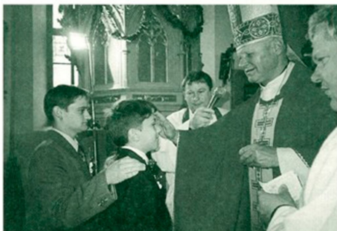
Birma je bila za osilniško cerkev in celotno občino lep in svečan dogodek.