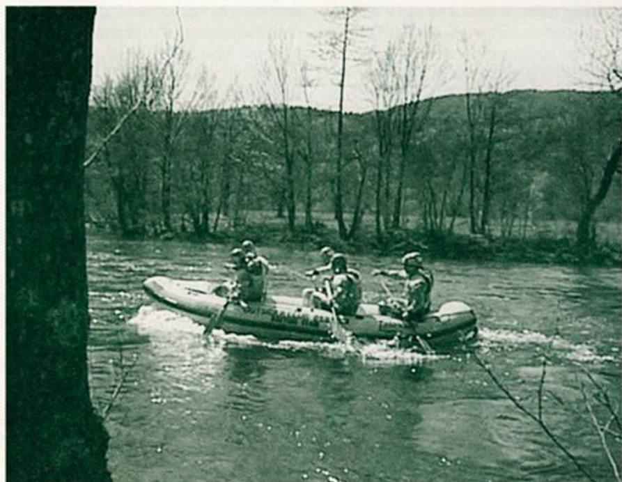
Že drugo leto zapored je med prvomajskimi prazniki potekalo na Kolpi državno prvenstvo v raftu.

Precej naporov je bilo potrebno, da so organizatorji izpeljali vse tekme. Tekmovalci so iz doline odšli zadovoljni in verjamemo, da se bodo ponovno vračali.