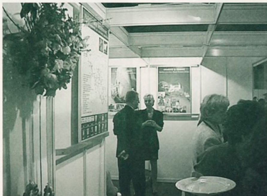
Na sejmu Alpe-Adria se sklepajo tudi posli.