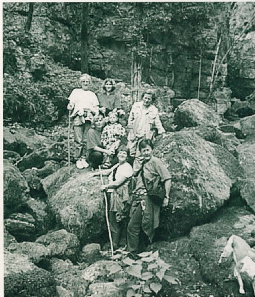
Mirtoviški potok je ena znanih naravnih znamenitosti naše doline in za turiste privlačna izletniška točka.