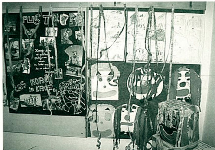
Za pusta so se otroci namaškarali in pripravili v šoli tudi razstavo mask.