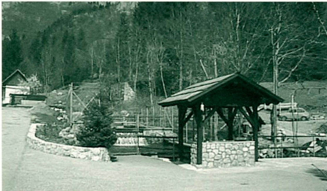
Naša dolina premore nešteto prijetnih kotičkov, primernih za piknike. Eden od takšnih je gotovo tudi v vasi Ribjek, kjer turisti lahko kupijo tudi sveže ribe.

Danes premoremo v občini 160 ležišč in prav toliko sedežev v odprtih in zaprtih prostorih. Gostom nudimo različne vrste prevozov po Kolpi, izposojajo koles, jahanje, lokostrelstvo, tenis, ogled nekaterih cerkva, različne pohode, lov in ribolov. Največ gostov, ki prihaja v dolino, je športnikov in rekreativcev, na drugem mestu so šolarji, slede družine; izletnikov, ribičev in lovcev je približno enak odstotek. Za vse te goste pa je značilen kratek čas bivanja v dolini, od 2 do 4 dni. Pretežen del gostov (skoraj 87%) je Slovencev, sledijo gostje iz Hrvaške, Italije, Nemčije.