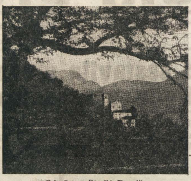
Pokrajina v Beniči Sloveniji.