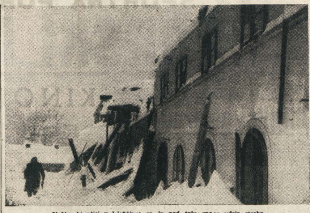
V Ninski ulici v Ljubljani se je pod težo snega udrla streha.