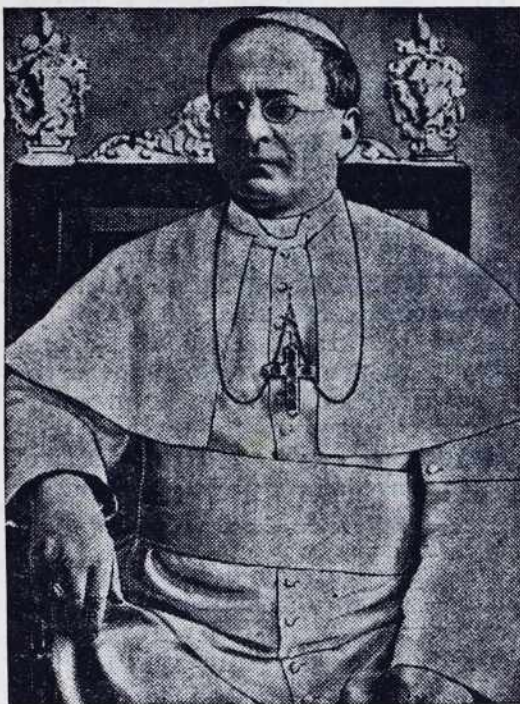
Papa Pius XI.

širi kaj Cerkvi nasprotnoga, te to vernikom naznanijo. Edino púšpeki so pozvani, da povejo: ka je proti veri i Cerkvi! So med nami takši, ki našim dobrim, prostim ljudem pravijo: