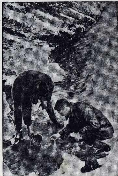
V Austriji so odkrili na več mestaj petrolejske vrelece. Slika nam kaže dva moža, štera sta našla nov vrelec v Dolnji Austriji.

Posojilnice so stale na razpotji: ali znižati obresti i tak omogočiti gospodarški obstoj dužnikom i sebi, vlagatelom pa zagvišati vloge v celoti, ali ostati pri dozdayšnoj obrestnoj meri i s tem gospodarško onemogočiti dužnika, sebe i vloge pa postaviti v nevarščino, da ne pravimo v gvišni propad. Naše posojilnice so se postavile na stališče pravičnosti, obresti, znižale, zato te stopaj s stališča narodnoga gospodarstva toplo pozdravljamo.