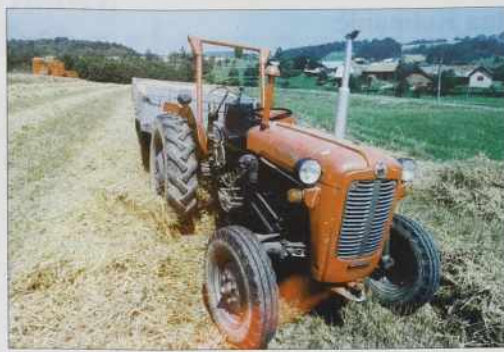
V vročini mašinge tū počivajo

- Dja sam cejlo življenje spoj fejš delala. Müva s pokojním možaum sva kosíla, žela vse na rokau. Težki časi so bili, ali mladoma človeka je tau nej težko. Zdaj, gda je človek stari, beleg pride vcuj, drügo je pa tau, ka si vözgarani. Ovak je pa življenje težko bilau, dapa zato lejpo. Ka smo pripauvali, vse smo zdravo djeli. Nej smo šprickali, nej smo gnojili z umetním gnojilom. Krave smo meli, svínje pa lejpo življenje. Gnes pa pripauvajo grozno dosta, ali ka pomaga, če je nikanej zdravo. Nejga zdravoga človeka, ka vse je strup (čemer). Mlajši so se oženili, mauž je devetdesetprvoga mrau, od tistoga sam čista sama.