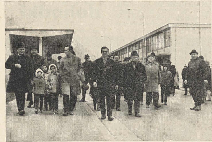
Skupine so se zbrale v upravni stavbi in pod vodstvom inštruktorjev odšle na ogled tovarne.

V stiskarni, cevarni, brizgarni in prevleki valjev so se zanimali za vulkanizacijo, vlaganje v kalupe, v brizgarni pa jih je brizganje spominjalo na izdelavo makaronov. V cevarni jim je bilo všeč opletanje cevi, izdelava spiralnih cevi, v vseh pa se je podrla prejšnja predstava o vlišanju, ko so videli, da je način izdelave popolnoma drugačen.