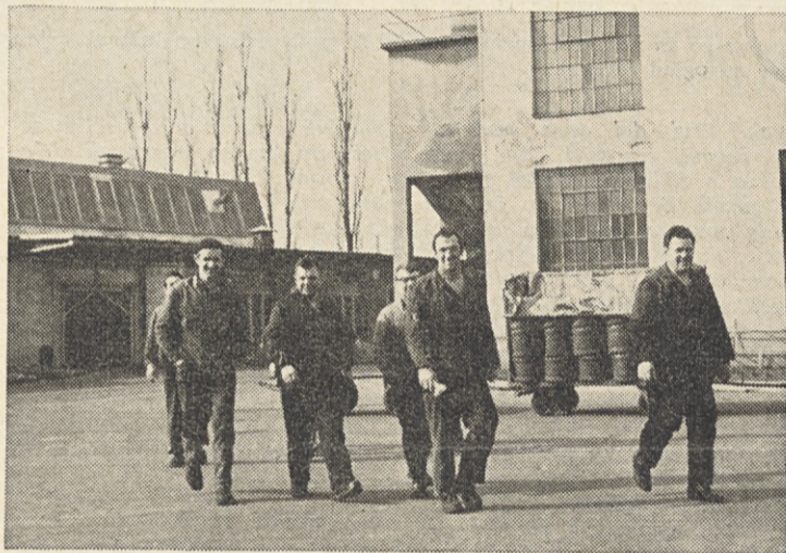
Srečanje na tovarniškem dvorišču.

Borce je pozdravil tudi predsednik ZB občine Kranj. Podprl je misel o sodelovanju z borci Koroške in izrekel pohvalo organizaciji ZB v Savi za prizadevano delo