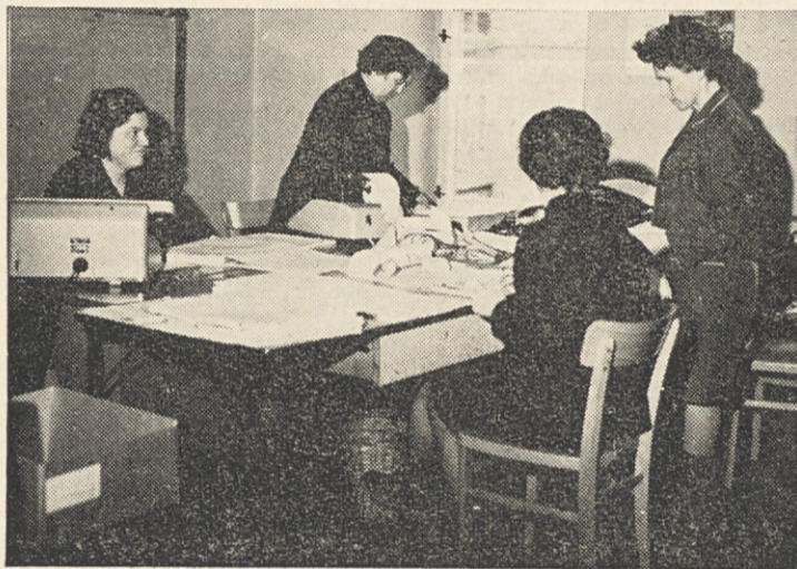
Finančna služba — knjigovodstvo OD dan pred izplačilom osebnih dohodkov.