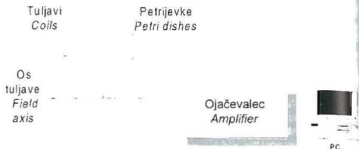
Pogled na petrijevke od zgoraj Petri dishes top view

Figure 1: Scheme of Experimental Equipment (Field Axis lies in East-West Direction). One circle represent 5 Petri dishes