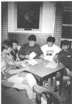
Na sliki: S. in F.Vitežnik, D. Rosa, ter S. in Andlovec

Iniciativno odbor Zdrženja veteranov vojne za Slovenijo - krajevni odbor Podnanos je 18. avgusta podal pobudo za