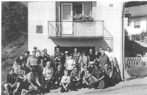
Na sliki: Posnetek vseh udeležencev 2. etape spominke poti pri spominski plošči v Trzinu.

etape je bila v spoznavanju izvidniških, zalednih, varnostnih in drugih nalog, ki so bile organizirane v skladu s takratno situacijo in so se menjavale z izredno dinamiko. Naloga zavarovanja vseh prebeglih vojakov in drugih oseb iz JA je bila skrivnost v juliju leta 91, zato so pohodniki še bolj prishahnilo takratnemu poveljniku zbirnega centra imenovanega "Lokvanj", v katerega so prebegnili Slovenci-vojaki na služerju vojaškega roka, z območja takratnih občin Domžale in Kamnik.