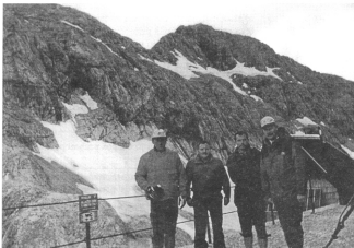
Na sliki: Domžalski veterani na Kredarici

Zato smo malce sklonjenih glav sklenili, da vzpona ne bo, pomembnejše je, da se vsi nepoškodovani varno vrnemo v dolino, oziroma na Pokljuko-do šport hotela, kjer je bila že ob 14.uri svečanost, katere se je udeležilo več tisoč obiskovalcev in na kateri je bil slavnostni govornik obrambni minister RS g.Tit Turnšek.