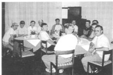
Na sliki: pripadniki 174. Pdv TO Brežice na družabnem srečanju

Ob zaključku srečanja so člani tudi sprejeli odločitev o izdelavi lastnega znaka enote, hkrati pa izrazili nezadovoljstvo glede njihovega nerešenega zahtevka po dodelitvi bojnega znaka »Krakovski gozd«.