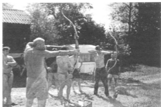
Na sliki: pripadniki 174. Pdv TO Brežice na lokostrelski preizkušnji

V vojašnici Cerklje ob Krki so v sodelovanju 25. Območnega štaba izvedli streljanje z malokalibrsko pištolo, se nato s člani športnega društva Razlag Čatež odpravili na 15 km dolg spust s kujaki in kanuji po reki Krki od Kostanjevice na Krki do Čateža, ob koncu pa se s pomočjo instrukcij Lokostrelskega kluba Čatež, preizkusili v lokostrelstvu oz. streljanju z t.i. »golinim lokom«.