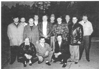
Na sliki: »Kleščarni« iz Šentilja

Slovenijo. Želja se mi je kmalu uresničila, saj so prišli pone domov in me obvestili, da se moram takoj zglasiti na zbirnem mestu v KS, kjer se nas je zbralo 27 tankistov z nalogo priti v Šentilj in pripraviti bojno tehniko za boj. Še posebej sem bil ponosen in srečen, da sem bil izbran za poveljnika te enote.