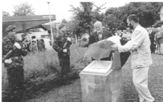
Na sliki: Odkritje spominske plošče na Vrhniki 2. julija 95

Poleg reševanja statusnih vprašanj posameznikov, pa je ena osrednjih nalog našega Območnega odbora zagotoviti spominskemu znaku Vrhnika-Logatec status spominskega bojnega znaka MORS-a. Omenjeni znak podeljuje pov. 53. obrn. PSV Logatec vsem veterankam in veteranom, ki so sodelovali v odporu proti agresorski jugovojski na teritori-