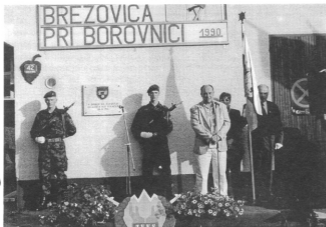
Na sliki: Srečanje veteranov ob 5. obletnici vojne za Slovenijo pred spominsko ploščo v Brezovici