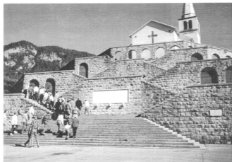
Na sliki: Kostnica nad Kobaridom