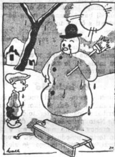
Dva, ki žalujeta za zimo...