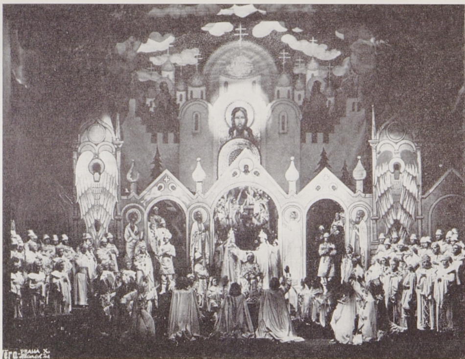
Rimski-Korsakov: »Neznano mesto Kitež« v Narodnem divadlu v Pragi aprila 1938. Režiser dr. Branko Gavella, scenograf Nikolai Benois