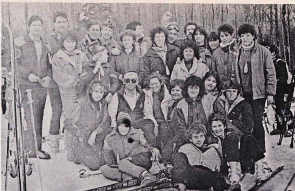
Najštevilčnejši so bili smučarji iz Zale. Pa tudi najglasnejši in najuspešnejši.