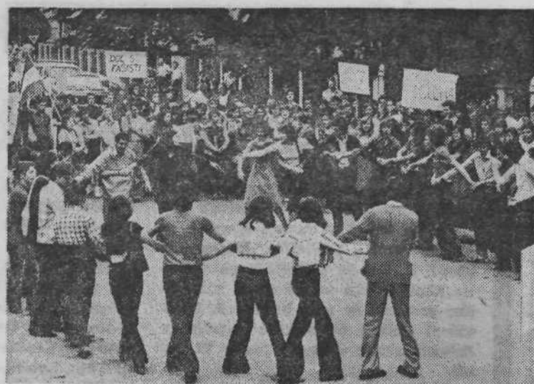
Demonstranti so plesali tudi kolo, simbol bratstva in enakopravnosti.