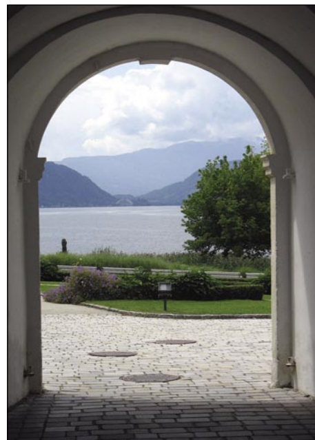
Tau so videli baratke v Osojaj, če so prejk dverii gledali

Najvekše jezero na avstrijskom Koroškem je takzvano Vrbsko jezero (Wörthersee), štero se vlečē 16 kilomejterov od turističnoga mesta Vrba (Velden) do varaša Celovec (Klagenfurt). Ime „wörth“ znamenūje v starom germanskom geziki