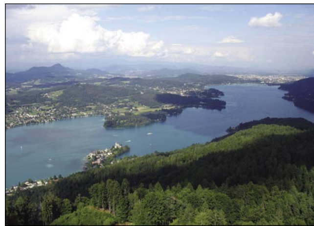
Vrbsko jezero od vrkaj - z lejvi kraj Otok, s pravoga Celovec

Pravi center Beljaka je biu sploj lepau okinčan, rdeče-žuto-bej-