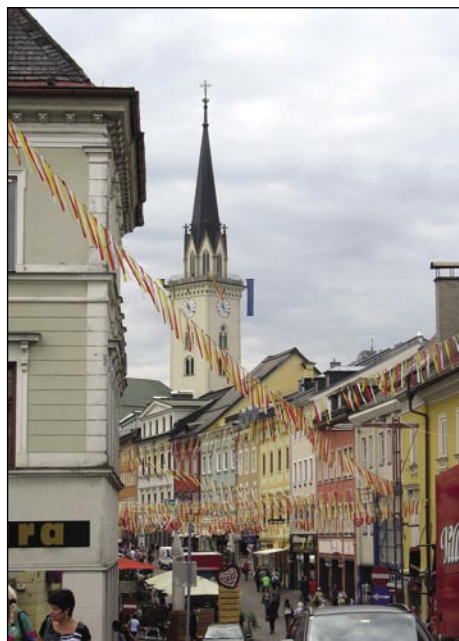
Beljak na srečanji poštij - okinčan za svetek

Gda smo mi auto sparkerali pa vōstaučili v koroškem varaši, smo včasik vidli ednoga policaja, šteri je vsikšoga poštrafo: