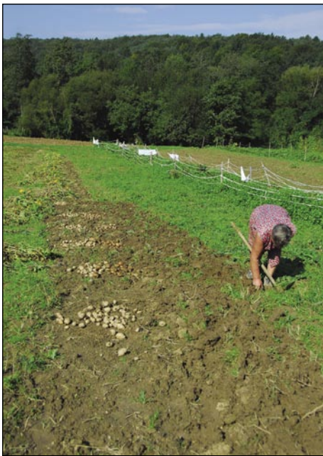
Letos so krumplinge tö nej dosti vrejdni

zdaj domau pripela iz lesa. Vej že gnauk bau, samo tau