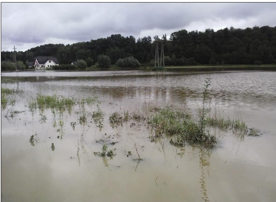
Poplave pri Slovenskoj vesi. Voda je visko stala v prvij izi na pravo, če pridemo iz Sakalouvec