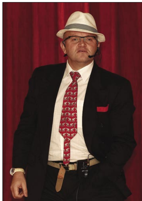
Roké nemajo ka iskati v žepki

špek jo«. Sogovornik, steri eške gnesden v Šalovcaj dostakrat pogledne svojo žlato, se ma tüdi za Goričanca, nej samo Sobočanca: »Na Goričkom je furt fajm. Ne razmejm tiste, ka so