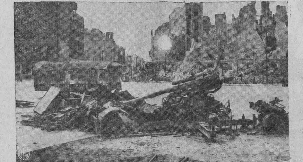
Ostanki Berlina. — Ko so počistili ulice razvalin in druge navlake je ostal na eni izmed številnih razbitih ulic razdejan nemški top. V ozadju slike je videti posledice za- vezniške bombardiranja in topovskega ob streljanja. Pravijo, da je Berlin — mrtvo mesto.