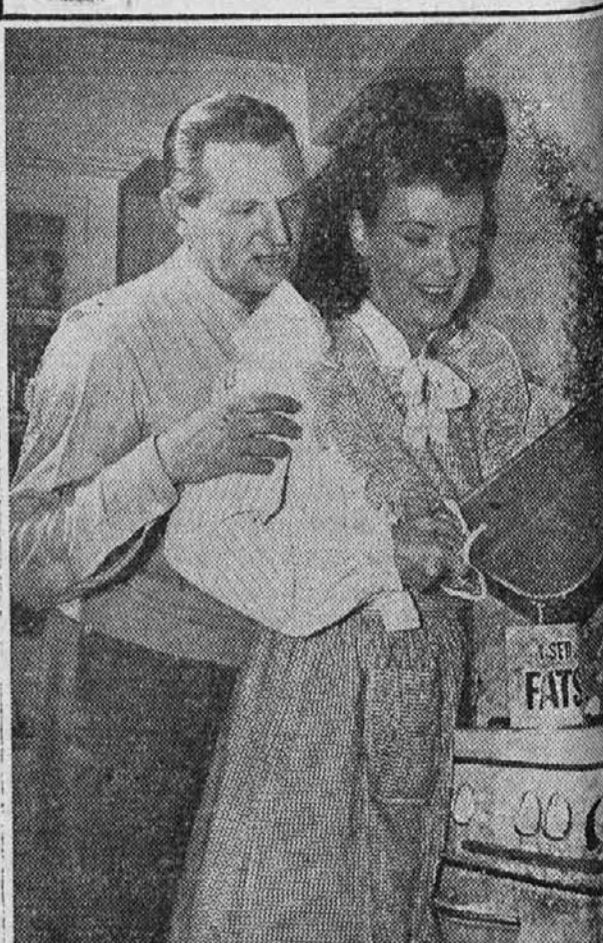
Jane Froman, singing star, accumulates her share of home front, by salvaging used cooking fat under the name of her husband Don Ross. Used cooking fat is needed to help produce rubber, fabrics, soap, pharmaceuticals and thousands of other civilian needs. Save every drop.