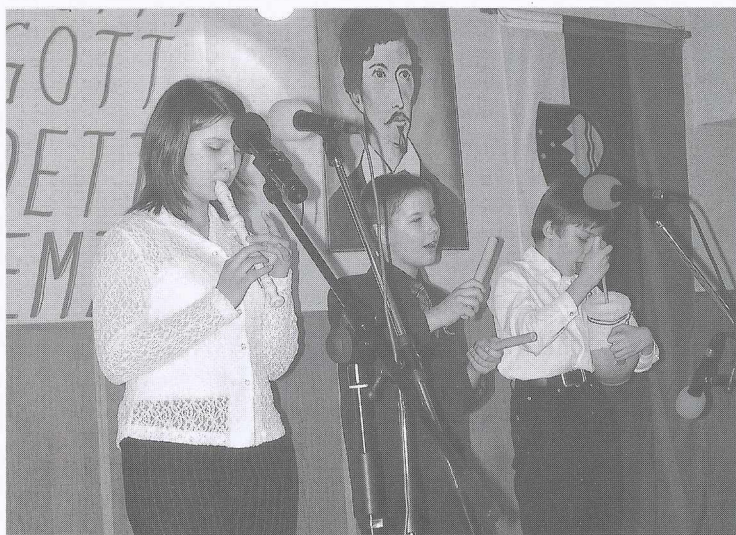
A Pártosfalvi KÁI tanulóinak fellépése a szentlászlói ünnepélyen.