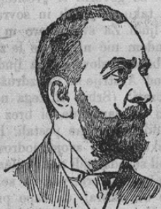
Marchese di San Giuliano

Poročali smo že zadnjič, da sta se v Salzburgu italijanski in avstrijski zunanji minister