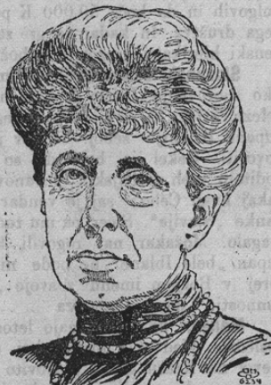
Königin-Mutter Maria Christine v. Spanien

Poroča se, da namerava španska kraljica-mati Kristina zaradi notranjih političnih zmešnjav svojo domovino zapustiti in se za stalno na Avstrijsko preseliti. Kakor znano je kraljica Kristina, ki je danes 53 letstara, hčerka pokojnega avstrijskega nadvojvode Karla in sestra nadvojvode Evgena, ki je tudi velik mojster „Deutschmeister“-reda. Za kraljico se baje že grad v Freudentalu pripravljala, v katerem bode