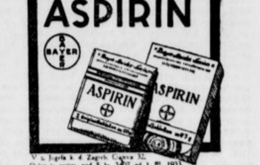
V. v. Jugla k. d. Zagreb, Capova 32. Oglas je registr. pod št. 3407 od št. 11. 1933.

Brez ozira kakšnega izvora je bolečina. Vam Aspirin tablete hipoma vrnejo ugodje. Vzemite jih brez skrbi! Pri nakupu pazite na Bayerjev križ. Ima ga vsak omot in vsaka tableta.