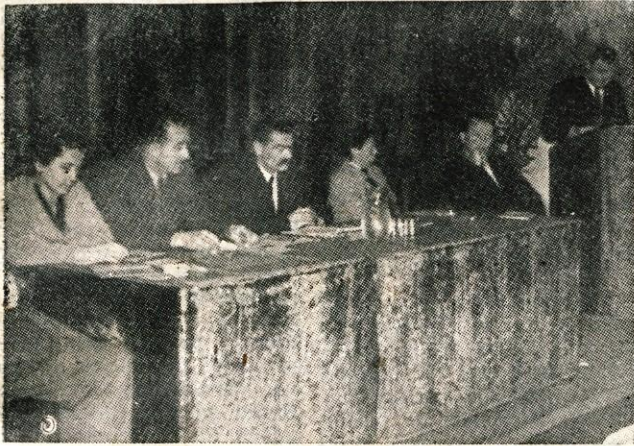
S konference ZK za kranjsko komuno