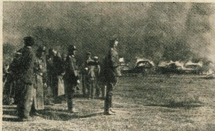
Okupator omaguje: v onemoglem besu požiga vasi

so zatrepotali na usnjenih zelenih plaščih in črnih kravatih. Nad vasjo je visel siv, težak oblak.