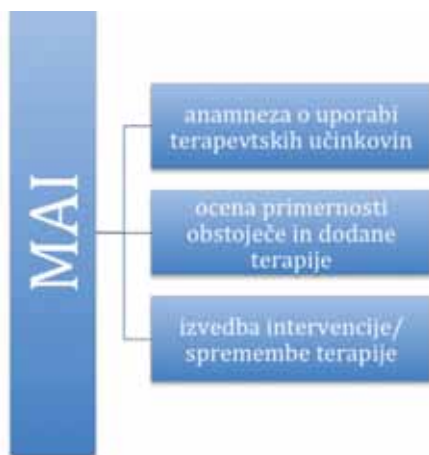
Graf 2: Predstavitev modela MAI Graph 2: Presentation of MAI

Med dodatnimi ukrepi, ki pripomorejo k varnejšemu predpisovanju zdravil so: natančna anamneza; dosledno upoštevanje pravil predpisovanja zdravil; motivacija bolnika za odgovorno in kritično uporabo zdravil, prehranskih dopolnil, zdravil rastlinskega izvora in drugih alternativnih oblik zdravil; ocena potrebnosti in koristnosti predvidene terapije; prilagajanje terapije obstoječemu zdravstvenemu stanju bolnika in spremljanje morebitnih NUZ, ki se jim