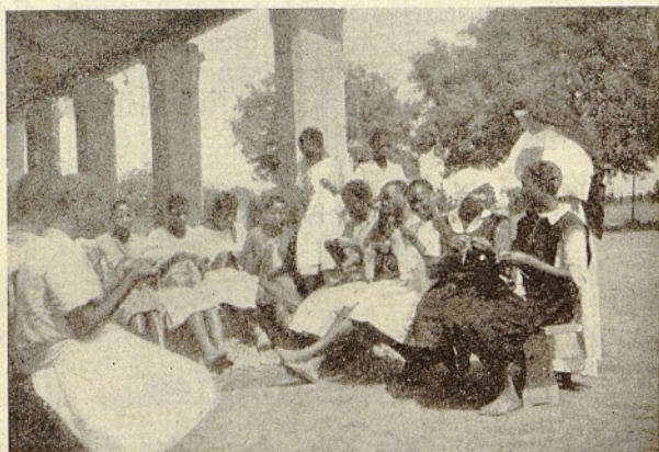
Strickschule Glen Cowie

Vor allem sparen die Eltern, deren in Betracht kommenden Burschen vielleicht abwesend sind, keine Mühe, um sie zur Eröffnungsfeier zur Stelle zu haben. Nebenbei bemerkt, wird aber kein Junge zur Schule zugelassen ohne Zustimmung seines Vaters oder Vormundes. Eine Ausnahme macht man nur bei Söhnen christlicher Eltern, wenn solche sich zur Schule anmelden ohne die vorgeschriebene Erlaubnis und ohne deren Begleitung. Ebenso werden regelmäßig nur Burschen desselben Stammes zugelassen, wenngleich der Häuptling Ausnahmen gestatten darf. Mußten die Kandidaten früher ein Alter von 15—17 Jahre erreicht haben, so läßt man heutzutage schon jüngere zu, weil die Furcht immer mehr sich ein-