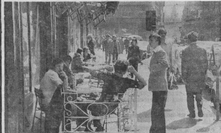
ZEJA — V teh toplih junijskih dneh so se začeli polniti letni gostinski vrtovi, ki so jih ljubljanski gostinci odprli že pred dobrim mesecem.

skupaj s starši zapustnika, če ta ni zapustil nobenih otrok.