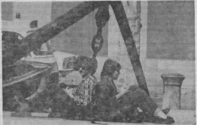
PREDAH — Studentki sta si za krajši predah med študijem izbrali kar sidro na Trgu osvoboditve.