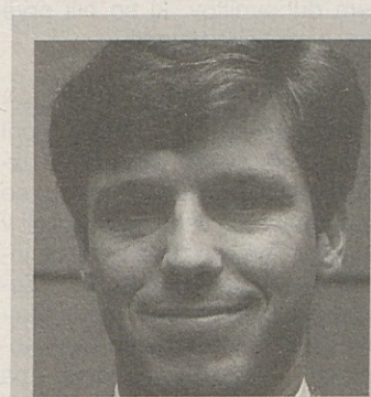
PIŠE VLADIMIR SMRTNIK

To spoznanje zame pomeni, da sama prezentacija bogate kulturne ustvarjalnosti narodne skupnosti v prihodnosti ne bo več zadostovala. Slovenci nismo neka „turistična atrakcija“, ki se jo pač rado pokaže, kadar to ravno ustreza konceptu. Smo pomemben del koroške stvarnosti, ki ima vso pravico, da oblast v deželi in državi, kjer živimo, spoštuje naš jezik, našo