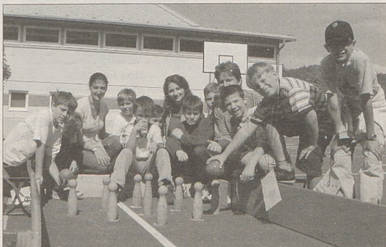
Mladina z veliko vnamo sodeluje, predvsem na ljudskih in glavnih šolah so projekti dokaj priljubljeni.

Srečanje mladine s projekti iz alpsko-jadranskega prostora (A, SLO, I): čezmejno znanstveno sodelovanje, tremeja, Slovenija, skrivnostna dežela onstran Karavank, zgodovina, družboslovje, obletnica izselitve koroških Slovencev, etnologija, kultura & film & gledališče, jezik & narečje, turizem, rekreacija in kulinarika.