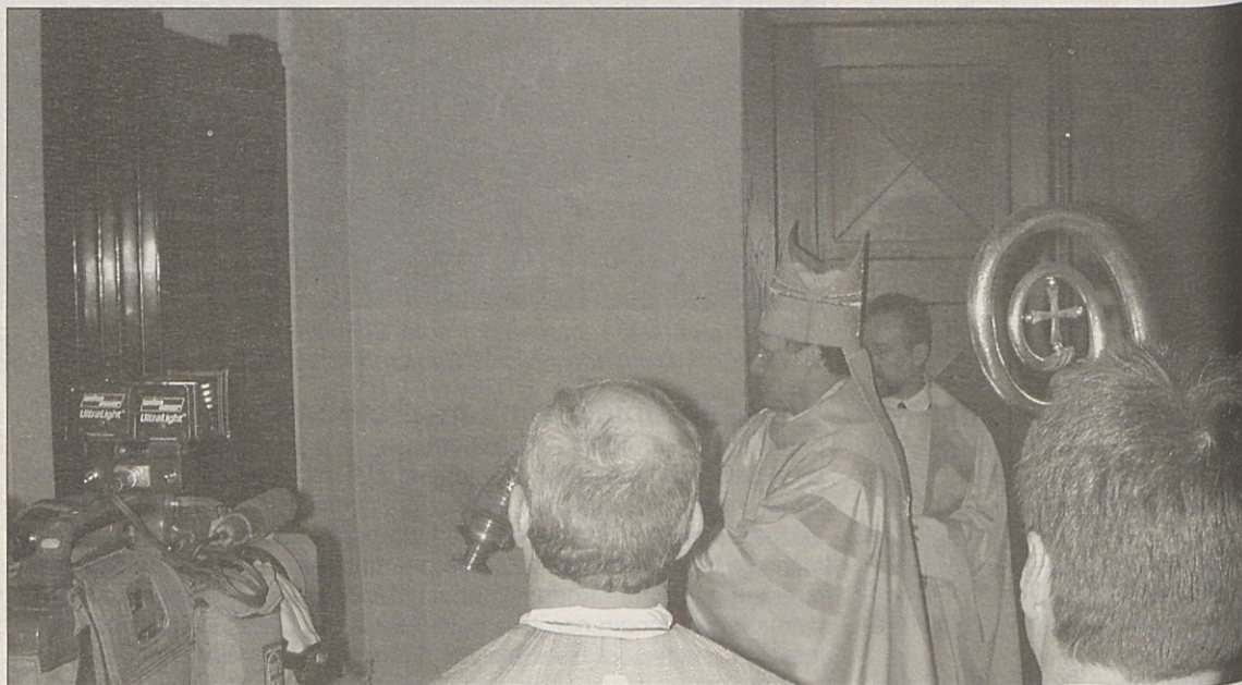
Škof Alois Schwarz je v nedeljo blagoslovil spominsko ploščo mučenikom 20. stoletja.

Po sveti maši je Alois Schwarz v stolnici blagoslovil spominsko