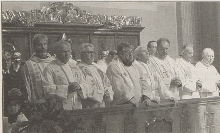
Sveto mašo je sooblikovalo 33 slovenskih duhovnikov.