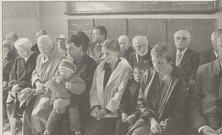
Maše in spominske svečanosti se je udeležila velika množica.