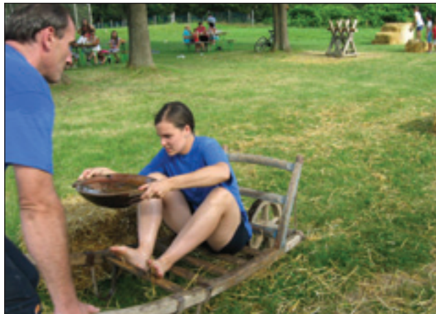
Vreme je bilo toplo, če smo se polili z vodo, nas je osvežilo

simo imeli živo slovensko glasbo, udeleženci so bili oblečeni v kmečke obleke. Vaščani so slišali slovensko glasbo in so se nam nekateri pridružili