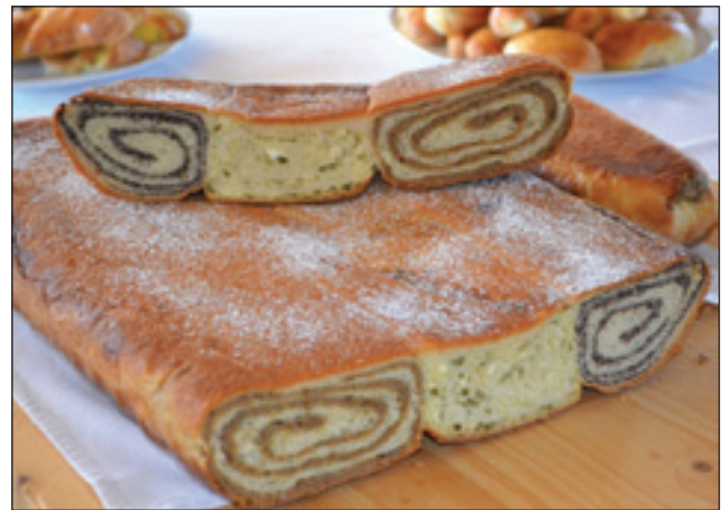
Makove, orehove in pehtranove potice – kot jih delajo v Sloveniji

peciva – orehovo, makovo in pehtranovo potico, ptičke, rogljičke z orehovim nadevom ter sončnico. Posebej je bilo narejeno testo za vanilijeve žepke. Tudi šef kuhinje Slovenske kmetije Csaba Steffel je predstavil udeležencem, kako se dela porabska