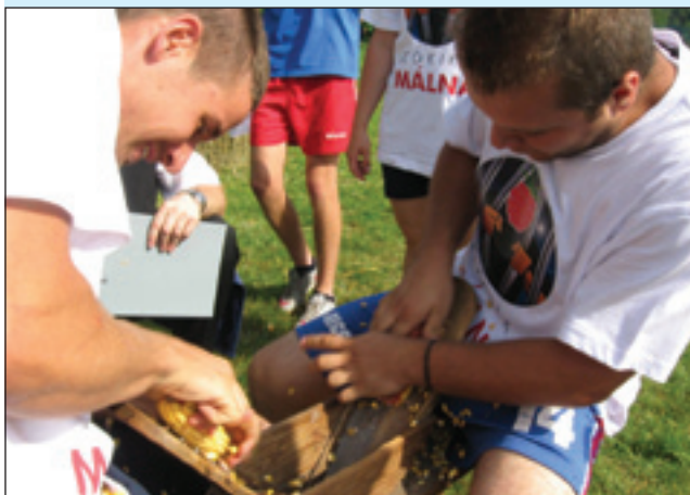
Koruzo se je luščila na »stauci«

Igre so bile lani del programa vaških dni in smo jih tudi letos načrtovali tako. Zaradi slabih vremenskih razmer v času vaških dnevov smo mo-