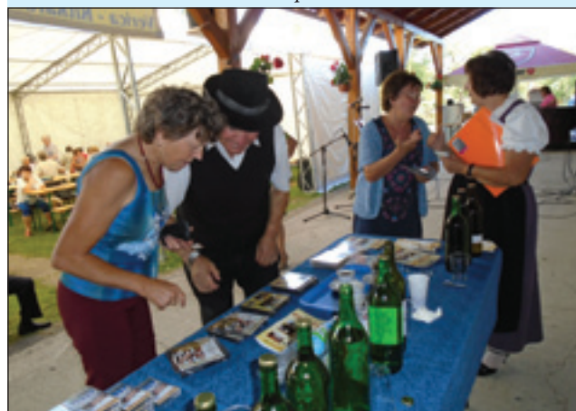
Ljudski godci Trio Vetrnica so nam nota pokazali svoje CD-ne pa dobro domanjovino.