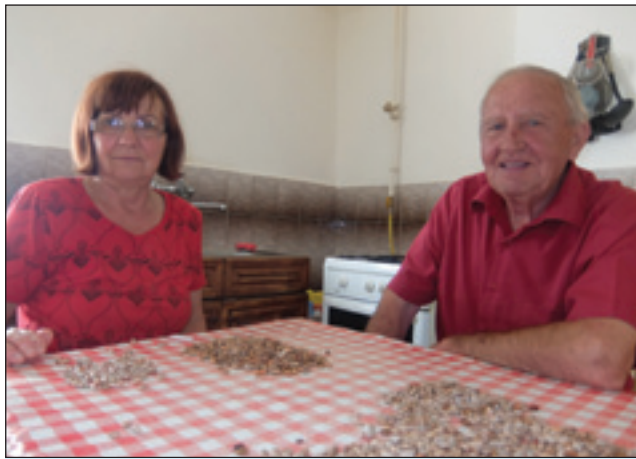
Irinka pa Karči sta ranč gra prebirala, gda sem pri njija odo

en tir napravli, gde smo leko odli. Gda smo mali bili pa velki snejg spadno, te je pa vsigdar ati naprej üšo pa on je nam tir napravlo. Bilau tak, ka smo nej mogli domau, ka se je snejg sipavo, te je pa prauto prišo. Spoj lejpe