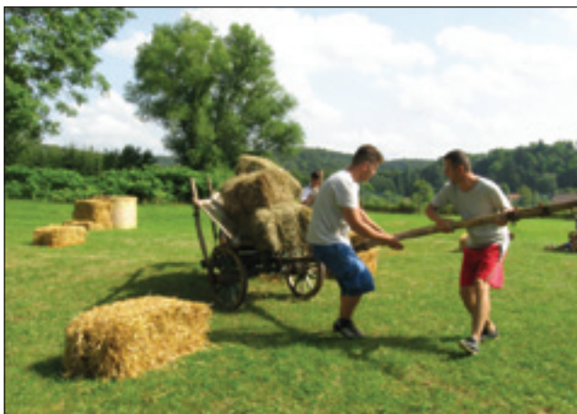
Kmečki voz je imel vlogo v več igrah

Program se je začel s povorko od kulturnega doma do nogometnega igrišča. Na povorki