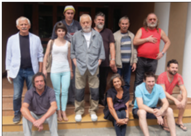
Udeleženci in organizatorji 15. mednarodne likovne kolonije pred Slovenskim domom

rah ostane nekoliko temnejša barva« - je o ustvarjalnem postopku povedal Ferenc