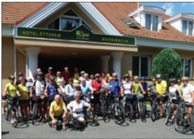
Kolesarke in kolesarji društva KOLOART pred Slovenskim domom po vrnitvi iz Soprona