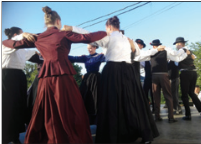
Sakalovska folklorna skupina Zveze Slovencev na Madžarskem

Slovenska narodnostna samouprava Monošter-Slovenstikov, obenem se lahko rodijo tudi nova prijateljstva. Na-