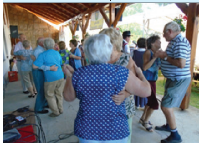
Na muzikoTria Vetrnica smo plesali do konca piknika.