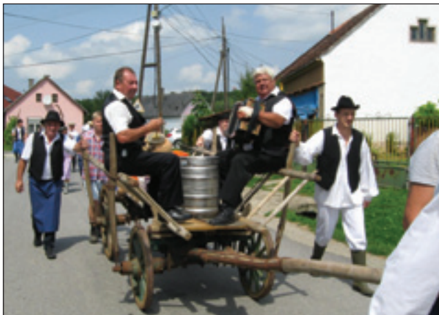
Povorka s kmečkim vozom in muzikanti

bila priprava bograča, ki smo ga na koncu seveda pojedli. Imeli smo zanimive igre tudi v tem letu: kotalili smo bale, luščili koruzo, vlekli smo sta-