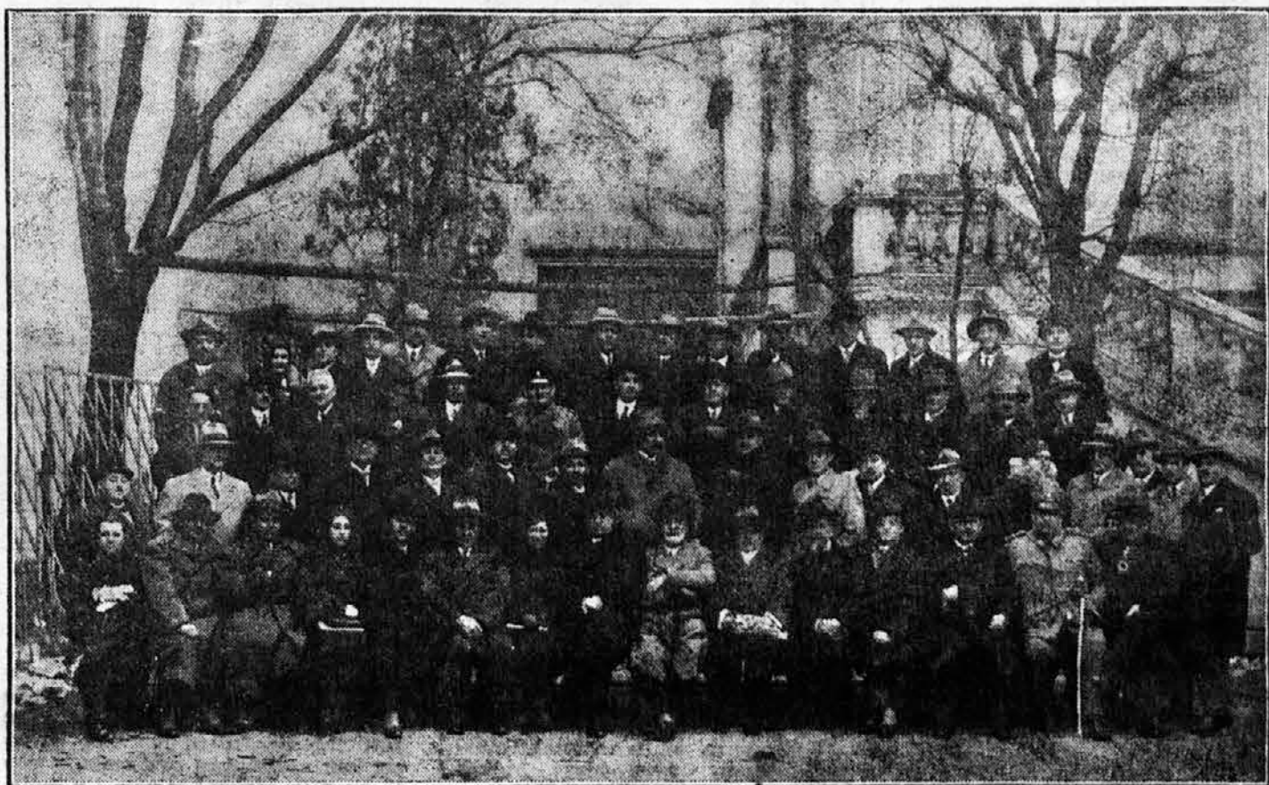
Učesnici prve godišnje skupštine Saveza Sokola kraljevine Jugoslavije

Prvom reči, koju izgovaram sa- da kod otvorenja prve redovne glav- ne skupštine Saveza Sokola kralje- vine Jugoslavije, upravljam svoje mi- sli Nj. Vel. Aleksandru I., (Burni i oduševljeni poklič: Živeo Kralj!) Kralju Jugoslavije, našem uzvišenom vladaru i pokrovitelju! Kralju iz na- roda i potomku slavnog roda Kara- dorđevića, koji su svojim delima ste- kli sebi najodličnije mesto u istoriji našega naroda. Ovom junačkom i vi- teškom vodi i kormilaru naše države želim u ime čitavog našeg Sokolstva potpuno zdravlje i dug život na ra- dost i sreću svih Jugoslovena, koji žive bilo gde prekaljeni ljubavlju prema Njemu i Njegovom Domu! Sokoli, sinici majke Jugovića sa sta- rim Jug-Bogdanom, u burnoj, teškoj i dugoj dobi naših porodičnih muka upravo čudesno su se razmnožili, ta- ko da danas potamnjuje sunce od smelo ispruženih krila sivih Sokolo- va, kad nebrojena naša jata kruže brdima i dolovima širom naše otadž- bine! Iz šuma lepršanja i zamaha ovih krila rada se jedan glas i jedna misao provejava čuvstva svih: da bi naše delo bilo blagoslo- vljeno znojem vlastitih na- pora na čast i slavudomovi- ne! Sa radom hoćemo ispovediti, šta osećamo, i plodovi sokolskog rada neka glasnije govore nego li reči, ka- ko iskreno mislimo i duboko oseća- mo, kada sa ovoga mesta šaljemo svome Kralju i Njegovom Domu svoj sokolski pozdrav: ZDRAVO! (Skupština oduševljeno popraća us- klikom: Zdravo!)