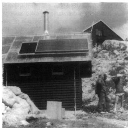
Sončne celice skrbijo, da bo hišica topla tudi pozimi

Kako rešiti problem stranišč v planinskih postojankah, je bila dostikrat rdeča nit pogovorov na sejah GK ter med vožnjami in hojo na ogled planinskih postojank. Vedeli smo, kaj približno želimo: stranišče, kjer ne bi več uporabljali vode, saj bi sicer kmalu morali reševati problem odplak s (predragimi) čistilnimi napravami, kemična stranišča tudi niso prišla v poštev, ni pa