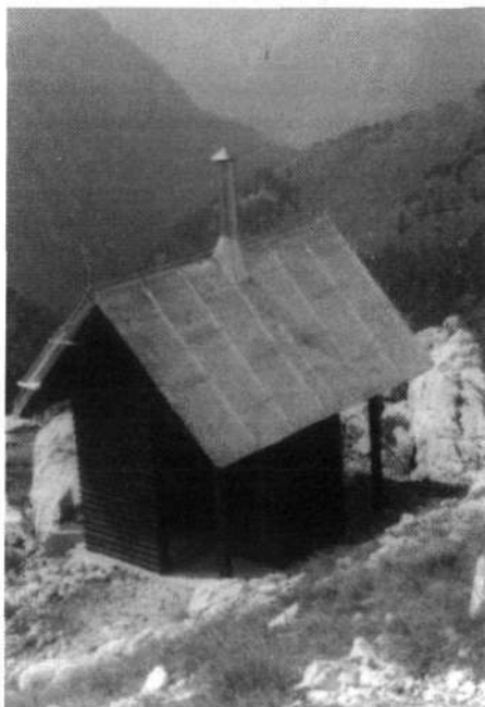
Ekološko gorsko stranišče na Prehodavclih: spomladni bo videti, kaj se je tam dogajalo pozimi