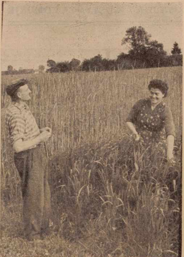
Pšenica, rž, krompir, koruza — takšna so naša polja. Prve razprave o upajanju vaškega kolobarja pa so pokazale, da se naši kmetovalci vedno bolj zavedajo, kolikšne urodnosti je vaški kolobar, ki bo omogočil cenejšo strojno obdelavo zemlje

Priprave so torej v teku. Cim bodo izenačili kulture na posameznih področjih ter kakovost zemlje, bodo prešli na pridelovanje po enotnem kolobarju. V zadrugi omenjajo, da bodo lahko vaški kolobar do cela uvedli v dveh letih.