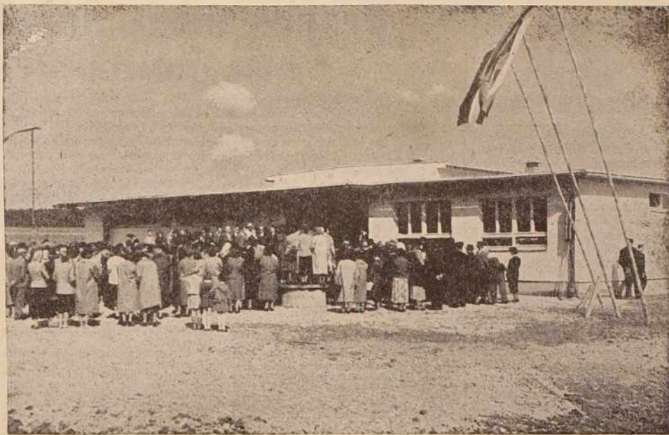
Vaščani Prosenjakovec in okoliških vasi so se pred nedavnim v lepem številu zbrali na otvoritvi novega obrata Pletiljstva

Poleg hlevov za 200 glav molznic bodo postavili še pitališča za 600 bikcev. V perspektivnem načrtu je tudi nadaljnje širjenje obdelovalnih površin, večje sodelovanje z zasebnim sektorjem, melioracijska dela in drugi ukrepi za kvantitativno povečanje in kakovostno izboljšanje krme za živino itd. Vedno bolj skrbijo tudi za zaposlene. Sedaj gradijo stanovanja za 9 družin, v prihodnjih letih pa bodo zgradili še 25 stanovanj. Za pridobivanje večje strokovnosti bodo na posestvu organizirali seminarje. Posameznike pošiljajo tudi na prakso. Stipendirajo 8 slušateljev na ustreznih strokovnih šolah, saj jim je srednji strokovni kader najbolj potreben zlasti v operativi.