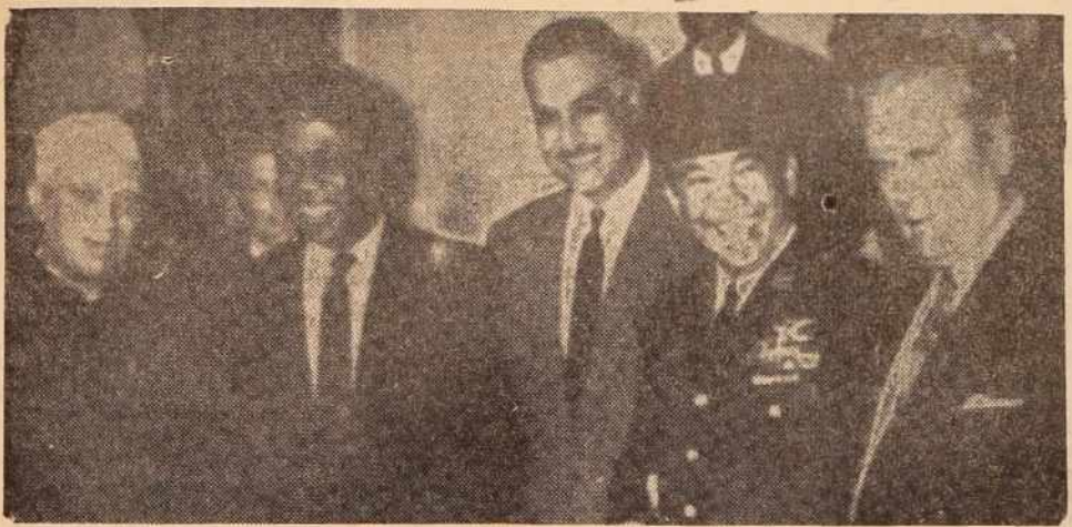
SESTANEK PETORICE: Od desne proti levi: predsedniki Tito, Sukarno, Naser in Nkrumah in premier Nehru

Dne 22. septembra je govoril na plenarni seji Generalne skupščine. Med svojim bivanjem v New Yorku je sprejel predstavnik jugoslovanskih izseljencev.