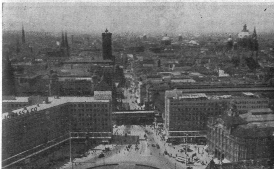
Svetovno mesto Berlin.

Nemci so se na olimpijado v vseh pogledih temeljito pripravili. Vse je bilo do podrobnosti urejeno in za vse je bilo preskrbljeno. Pomislite samo, koliko je bilo treba dnevno živil za prehrano tolikih množic! Mi smo imeli s seboj svoje kuharje, pogrešali pa smo naše dobro sadje, ki je v Nemčiji silno drago.