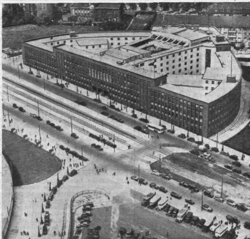
Velikomestni promet pred radio postajo.

|| Vsak narod in pokrajina ima svoje posebnosti. Vsak živi svoj način življenja. To je upošteval tudi olimpijski odbor, ki je skušal po možnosti ugoditi vsem tekmovalcem te ali one narodnosti. Za pet tisoč tekmovalcev je nastala pri Berlinu velika olimpijska vas. Japonski tekmovalci so se naselili tu že več tednov pred pričetkom olimpijade, da so se privadili severnemu podnebjju. Vsak narod je bil deležen posebne oskrbe. Največjo važnost so polagali na hrano, kajti prazna vreča ne stoji pokonci. Zato so skrbeli kuharji za »domačo hrano«. Kar prija Japoncu, to ne diši Angležu in obratno.