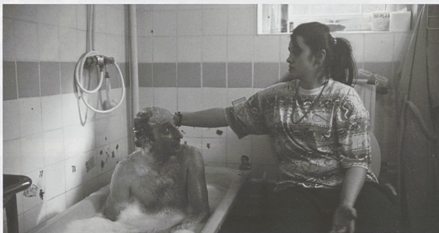
Eat Sleep Die

Morda ji je v tej držji nekoliko podobna protagonistka čilske Glorie (2013, Sebastián Lelio), za katero je Paulina García v Berlinu prejela srebrnega medveda za najboljšo igralko. Svobodomiselnost in želja po življenju naslovni junakinji preprečujeta, da bi se uklonila družbenemu okviru, ki ji ga vsiljujejo oznake matere, babice ali starej-