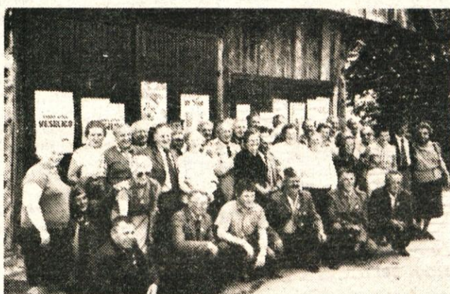
Kamniški udeleženci srečanja gorenjskih aktivistov in borcev NOV v Trzinu