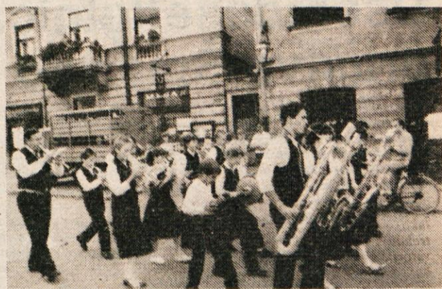
Mladi godbeniki iz Šmihela

In da bo še bolj nazorno, kakšne pesmi so v novi planinski pesmarici, naj zapišemo nekaj naslovov: od Čez tri gore do Srce je popotnik, od Balade o najlonki do Velike planine, od Martinovega lučka do Kamniških planin. Sicer pa: Kamniške planine so tako in tako najlepše, posebno za Kamničane! In z novo pesmarico v nahrbtniku... I. SIVEC