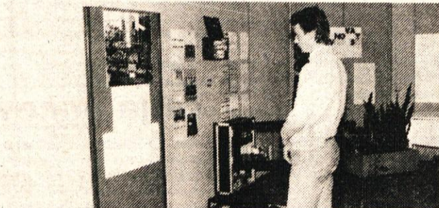
Obiskovalec si z zanimanjem ogleduje razstavljene inovacije.

Osebnost sem proti statističnemu obravnavanju tega problema. Primerjave so nerealne, ker izračune močno moti inflacija, ni pa tudi lahko priti do dobrih, točnih podatkov. Evidentirani niso vsi inovatorski predlogi in tako predstavljena slika ne bi bila prava.