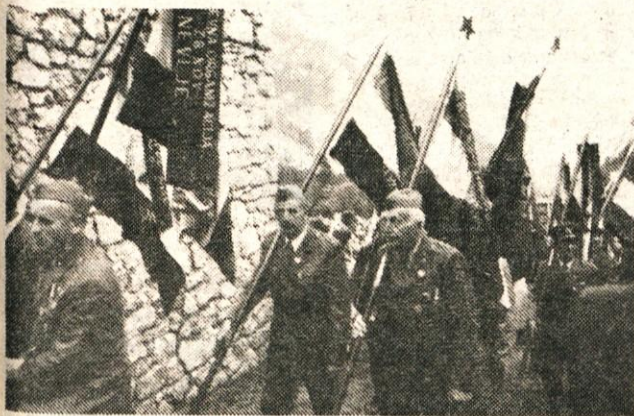
Naši zastavonoše pred spomenikom internirancev na Ljubelju