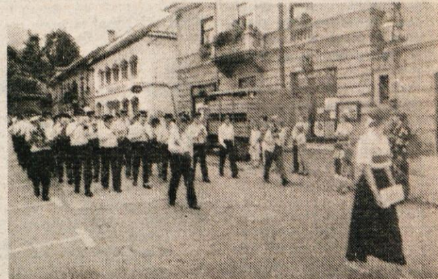
Domačini so bili najštevilnejši in lepo uigrani