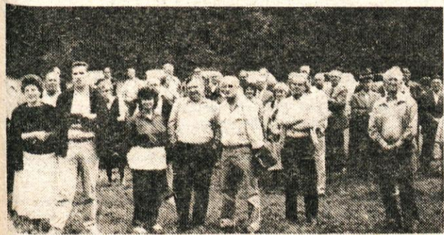
Gostje invalidi iz Doberdoba spremljajo kulturni program.