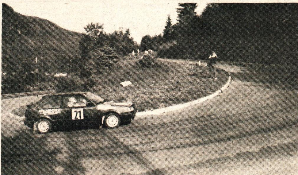
Oviniki na Črničev so voznikom povzročili sive lase, saj marsikdo ni pravilno uporabil menjalne ročice