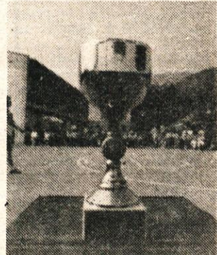
Pokal, ki ga je prejela zmagovalna ekipa Stranj.

Tekma je bila precej groba, čeprav v mejah dovoljenega. Zasluga za to, da se posamezne iskrice med gledalci niso spremenile v ogenj, pa gre neumornim kamniškim sodnikom, ki so