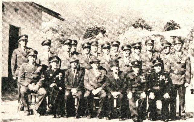
Častni in aktivni člani gasilskega društva Šmartno ob praznovanju 70-letnice društva