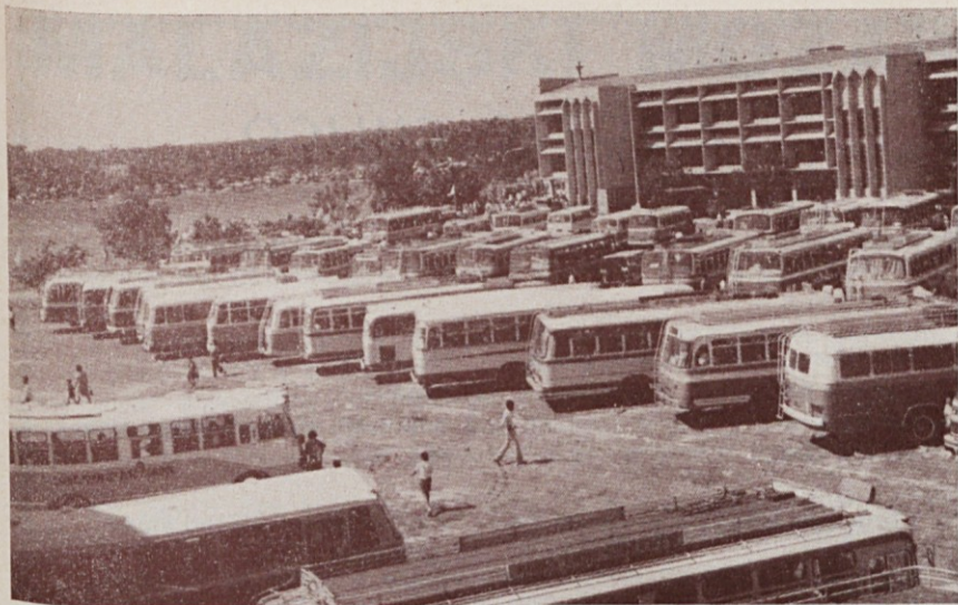
Poslopje vélikega semenišča v San Pramu, 30 km od Bangkoka, in avtobusi vernikov, ki so prišli na posvečenje. — Spodaj: mali semeniščniki pojejo pri maši.