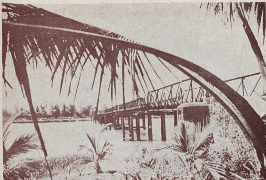
Most na meji med Severnim in Južnim Vietnamom.

Cerkev se je v Vietnamu prilagodila domačim okoliščinam: večstoletna kitajska kolonizacija Vietnama je še precej očitna. Vietnam je prva dežela na Daljnem Vzhodu, kjer je bil že v 17. stoletju ustanovljen red domačih sester Ljubiteljic sv. Križa.