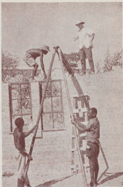
Oče Tomažin pri gradnji cerkve v Feira; spodaj ga vidimo s hrvaškim sobratom in črnimi šolarji pred eno izmed cerkvá, ki jih je bil že sezidal.