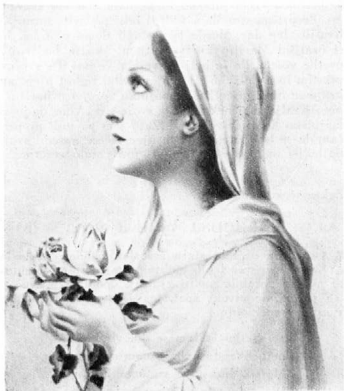
Najžlahtnejša majniška roža.