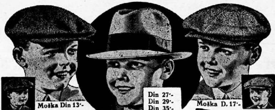
Moška Din 13.-

„Pod kostanji“ v novi trgovini pri farni cerkvi: