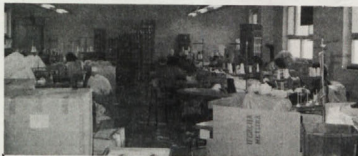
Komet ima svojo delovno enoto v Starem trgu. Stavba stoji na gričku, s katerega je lep razgled po dolini Kolpe. V notranjosti pa pridne roke deklet in žena šivajo nedrčke, steznike, steznik hlačke.