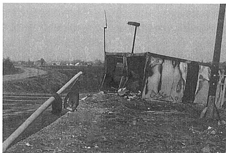
Posledice uničenja 8. MKT, ki so jih povzročili vojaki JA v jutranjih urah, 28. junija 1991.

To so bile pomembnejše aktivnosti prvega in drugega dne vojne na območju Občine Ormož, ki jih lahko nekoliko konkretnije povezujemo z zgodovino nastanka Mejnega prehoda za mednarodni cestni promet Središče ob Dravi.