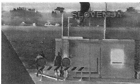
8. MKT Središče ob Dravi v obliki, kot je bila vzpostavljena 25. junija do uničenja 28. junija 1991. Fotografija je narejena iz posnetka s kamero v času, ko so MKT »pasirali« tanki na poti v Ormož. Osebe na njej so miličniki, ki so branili MKT.