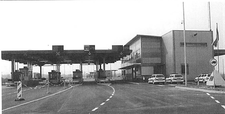
Nov CMMP Središče ob Dravi na Slovenski cesti, zgrajen spomladi leta 2007.

PMP Središče ob Dravi in vseh njenih mejnih prehodov. Dogajanja v času, ki se jih dotika vsebina prispevka, so bila zelo intenzivna, zahtevna in kompleksna. Zato poudarjam, da so v prispevku zajeta le z vidika delovanja milice oziroma policije in še to samo z vidika ene osebe. Da bi bili dogodki še celoviteje in pregledneje predstavljeni, bi zagotovo lahko prispevali navedeni: