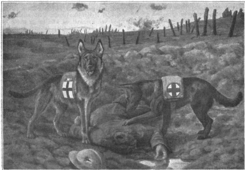
Sanitejska psa, kakor sta bila opremljena ob pričetku svetovne vojne, sta izsledila težko ranjenega vojaka

Danes so ti trdi, težki časi srečno za nami. Stari častivredni obred je zapadel pozabi. A vendar ne popolnoma. V novi, morda še plemenitejši obliki se je pojavil v trpečem človeštvu. Kadar že obupa uče-