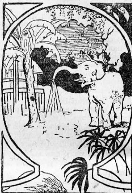
Kje je gonjač?