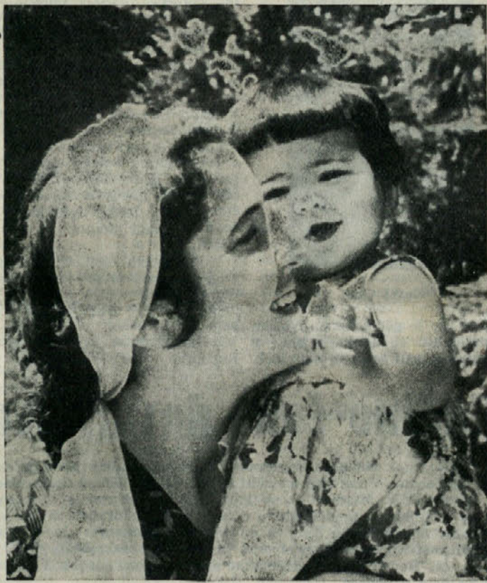
V čem je sreča delovnih ljudi? V bogastvu, slavi...! Ne! Slika nazorno prikazuje srečo mlade matere. In da bi sreča tudi z našega obraza tako žarela, je verjetno noveletna želja vseh nas!

Franc Blatnik, uslužbenec iz Predstrug pri Vidmu je dejal: »Moja želja za novo leto je, da bi se tudi v Dobropolju razvijala industrija. Nekaj industrije že imamo, ki naj bi se razvijala dalje.«