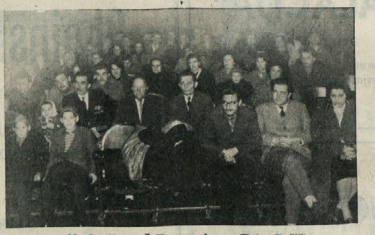
Akademija v Šeškovem domu.

je sodelovala na proslavi v tamkajšnji garniziji. Cestitali so oficirjem in podoficirjem k prazniku, komandantu pa izročili skromno darilo za priznanje za njegovo požrtvovalno delo pri strokovni vzgoji rezervnega kadra v občini Kočevje. Za uspele proslave v počastitev dneva JLA je treba dati vse priznanje Občinskemu odboru ZDROP in vsem, ki so sodelovali ali drugače pomagali pri proslavah. Da so proslave lepo uspeli gre zahvalnost tudi številnim udeležencem. Ljudje si takih proslav še želijo.