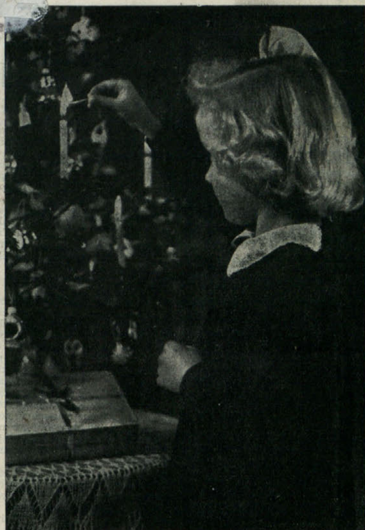
Prazniki novega leta so prežeti z otroškim veseljem ob okrašenih in obloženi novoletni jelki

Vse organizacije, kmetijske, zadrugne in družbeno politične, bodo zaradi tega morale večkrat, temeljiteje in neposredneje govoriti z našimi kmeti, jim pomagati da povečajo proizvodnjo in da tako pomagajo sebi izboljšati življenjsko raven in obenem prispevati k boljši oskrbi mestnega prebivalstva, da bi to ustvarjalo več in ceneje tudi za kmetško prebivalstvo.