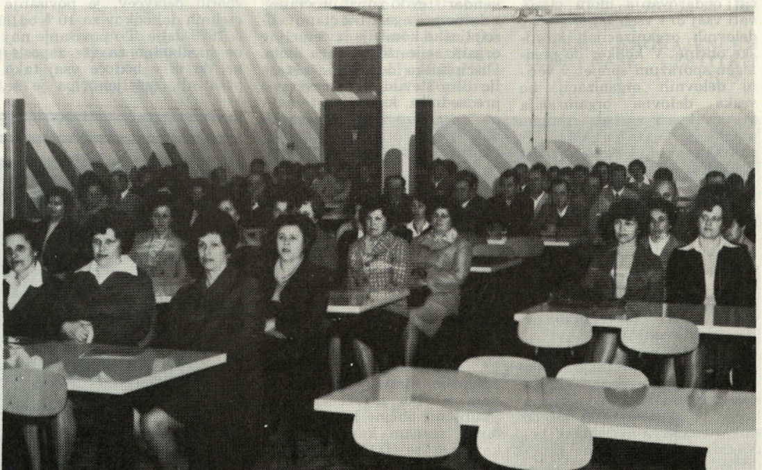
Prostori nove jedilnice v tkalnici. Več o tem berite na 3. strani

V prvem tromesečju letos je torej skupni prihodek pokrtil poleg za 18 % višjih skupnih materialnih stroškov in v bistvu enakih prispevkov in obveznosti iz dohodka kot lani, za 22 % povečane osebne dohodke na povprečno zaposlenega in končno tudi dobrih 9 milijonov ostanka čistega dohodka za sklade. V okviru skupnega finančnega rezultata so tudi vse temeljne organizacijske zaključile vsaka zase svoje poslovanje pozitivno.