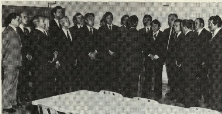
Moški pevski zbor iz Stražišča