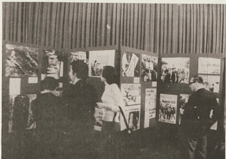
Z razstave »Koroški Slovenci v boju za svoje pravice« v SNG v Mariboru