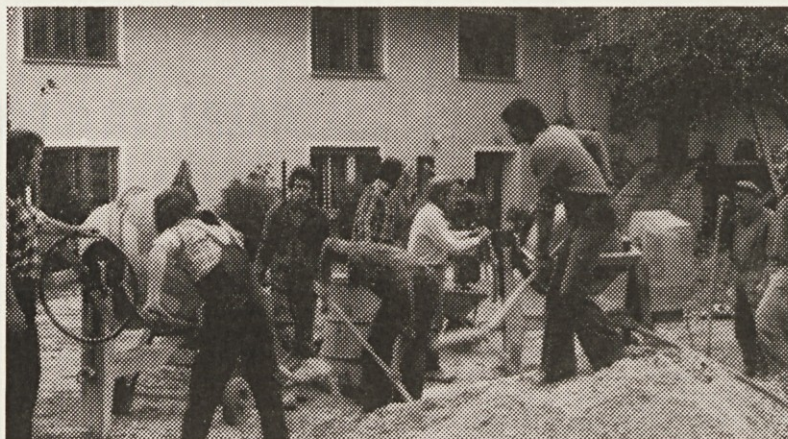
Na prostovoljni delovni akciji v Posočju: delavci tiskarne pomagajo v vasi Čezsoča pri Bovcu.

Iz te zagate bomo morali čimprej, drugače bomo v pogledu rokov še na slabšem kot smo doslej. Uspeli bomo le tako, da bomo napravili red pri oddaji rokopisov, napravili selekcijo časopisov in v najkrajšem času dopolnili foto stavek.