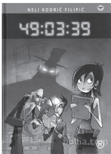
Slika 3: Neli Kodrič Filipič (2008), 49:03:39, naslovnica

V romanu Neli Kodrič Filipič 49:03:39 (2008; slika 3) je naslov dela povezan s časom: pomeni namreč čas, ko se Peter in Maša trudita književne like spraviti nazaj v njihove knjige. Književni čas je namreč zgoščen na malce več kot dva dni: od petka zvečer, ko čistilke zapustijo šolo, do nedelje zvečer, ko Peter in Maša pospravita šolo za knjižnimi junaki in odideta iz nje.