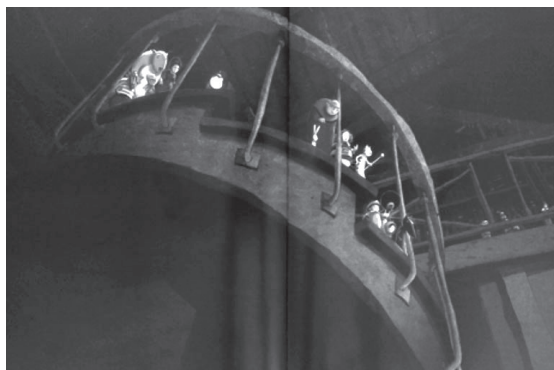
Slika 4: Knjige v knjižnici so naseljene . Anik Le Ray, Rébecca Dautremer, Hiša pravljic (2012), 20–21

... Od kod ste?' je bil presenečen Natan, ko je spoznal Obutega mačka, kapitana Kljuko, Pepelko, Rdečo kapico in celo zlobnega volka. 'Eleonora nas je zbrala tukaj' je pojasnila Pepelka. 'Z vsakega potovanja je prinesla nove knjige.' 'Knjige v knjižnici so NASELJENE,' je dodal Guliver.