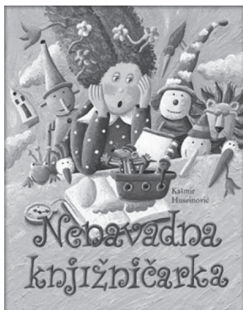
Slika 2: Kašmir Huseinović, Nenavadna knjižničarka (2011), naslovnica

V slikanici Nenavadna knjižničarka Kašmirja Huseinovića (2011, slika 2) so že v uvodnem delu zgodbe (jezikovni kod) in na prvih dveh ilustracijah