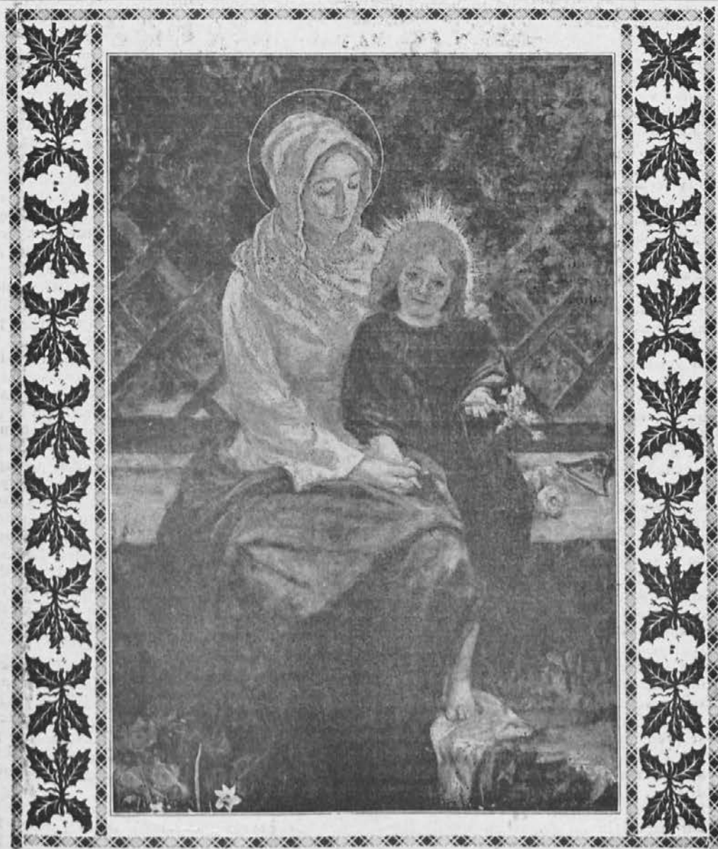
Marija! Nas ob koncu maja blagoslovi vse, kaži pot do raja, lajšaj nam gorjé.

"Oj, kaj sem storil", je klical bolnik. "Bil sem strašen grešnik. Umor imam na svoji vesti."