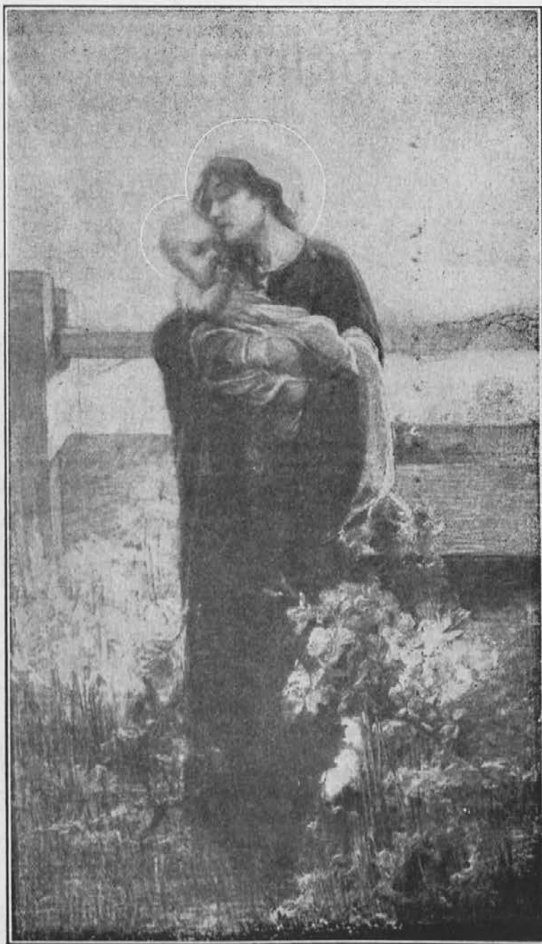
Roža skrivnostna, prosi za nas.