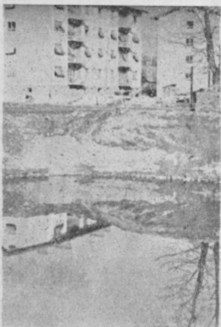
Takole globoka je jama, v katero bodo »vsadili« deset nadstropno stolpnico. Na vodni gladini se zrcalijo fasade novih blokov na »Otokus«.

Kako dolgo je še do tega? Ne preveč. Saj je nova mestna četrt »Otok«—Lisc skoraj do polovice že pozidana. Bo ta krat (traja lahko samo še nekaj let) stanovanjska stiska nasičena. Optimisti pravijo da bo, pesimisti spet, da ne. c. k.