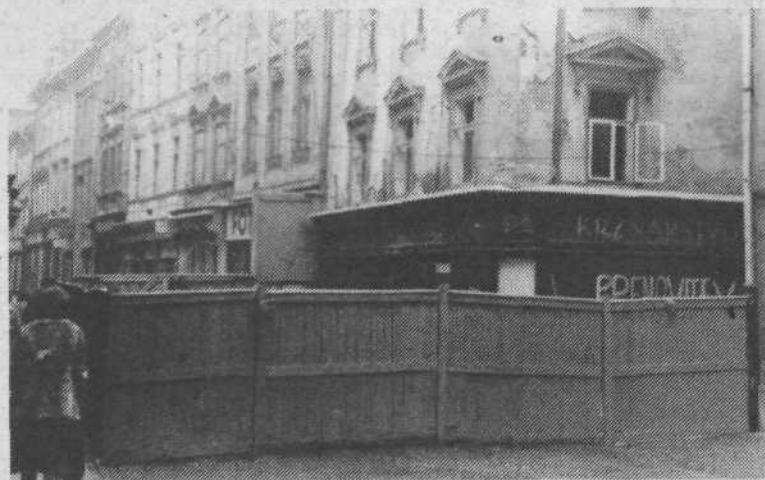
2. Končno se je le začelo. Obnova stare Ljubljane namreč. Eno najbolj razpadajočih hiš na Starem trgu so opasali s plotom in že začeli z notranjimi deli. Upajmo, da ta prva lastovka tudi dejansko pomeni novo pomlad tega dela Ljubljane.