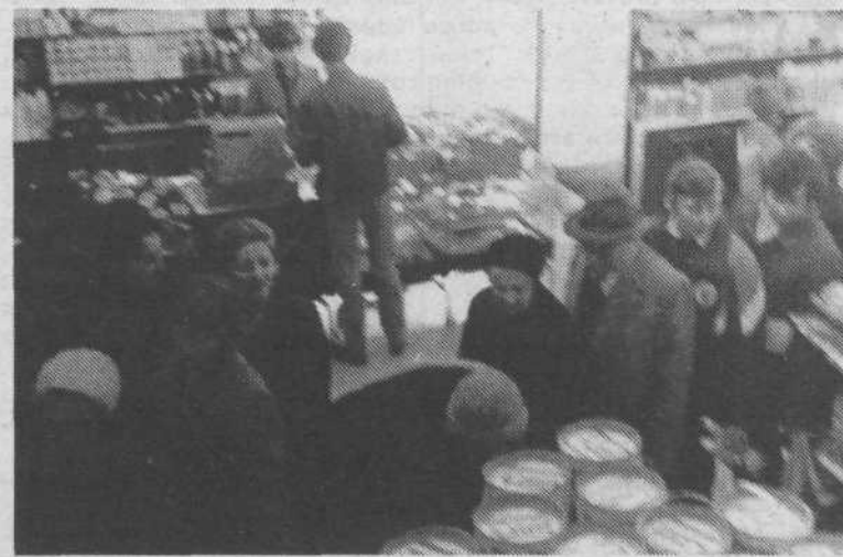
4. Pralni praški so še vedno najbolj iskano blago v Ljubljani. In kjer jih dobijo, se takoj naredi vrsta. Da bi te dragocene praške dobilo čim več gospodinj, ga vsaka dobi le en zavitek. Zato so takele vrste, kot smo jo pred nedavnim videli v Nami, dragocen vir zaslужka za marsikaterega dijaka. Za desetaka se postavi v vrsto in kupi pralni prašek za zalogo iznajdljivi gospodinj. Tako se časi spreminjajo, včasih smo preprodajali vstopnice za kino, danes pa vrstni red za pralne praške.

Pa saj nimamo nič proti takemu načinu prodaje in nakupa. Vendar pa menimo, da ti »štanti« le ne sodijo pod Plečnikove arkade. Kaj ko bi živilski trgi poiskali primernejšo lokacijo za te prodajalce, kje ob bregu Ljubljance?