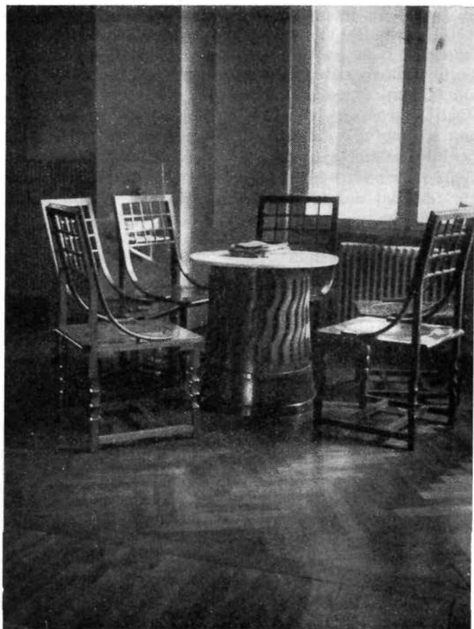
KOTIČEK V ČAKALNICI OSREDNJEGA URADA VZAJEMNE ZAVAROVALNICE V LJUBLJANI

Predvsem priča o tem duhu osrednji sedež VZ v Ljubljani, na oglu Masarykove in Miklošičeve ceste postavljena ponosna, 23 m visoka palača, ki jo je za-