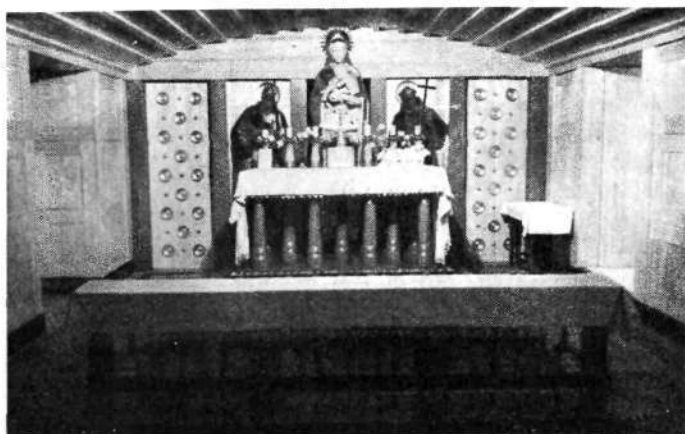
OLTAR V TURISTOVSKI KAPELI