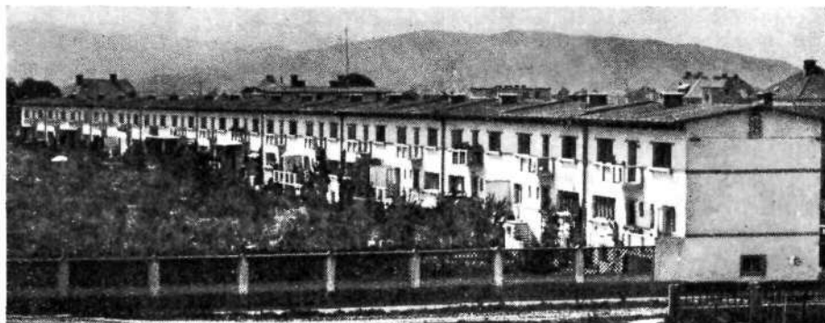
STANOVANJSKE HIŠE V DERMOTVI ULICI V LJUBLJANI, KI JIH JE DALA ZGRADITI VZAJEMNA ZAVAROVALNICA V LJUBLJANI

L. 1919. je pričela VZ tudi z življenjskim zavarovanjem in spremenila novemu delokrogu primerno svoja pravila, ki jih je osrednja vlada v Beogradu potrdila dne 10. novembra 1919. Pozavarovalno pogodbo za požarno zavarovanje je vzdrževala tudi po vojni do l. 1930. z Internationale Mit- und Rück-Versicherungs-Gesellschaft na Dunaju. L. 1931. pa je prenesla to pozavarovanje na Prvo češko pozavarovalno banko v Pragi.