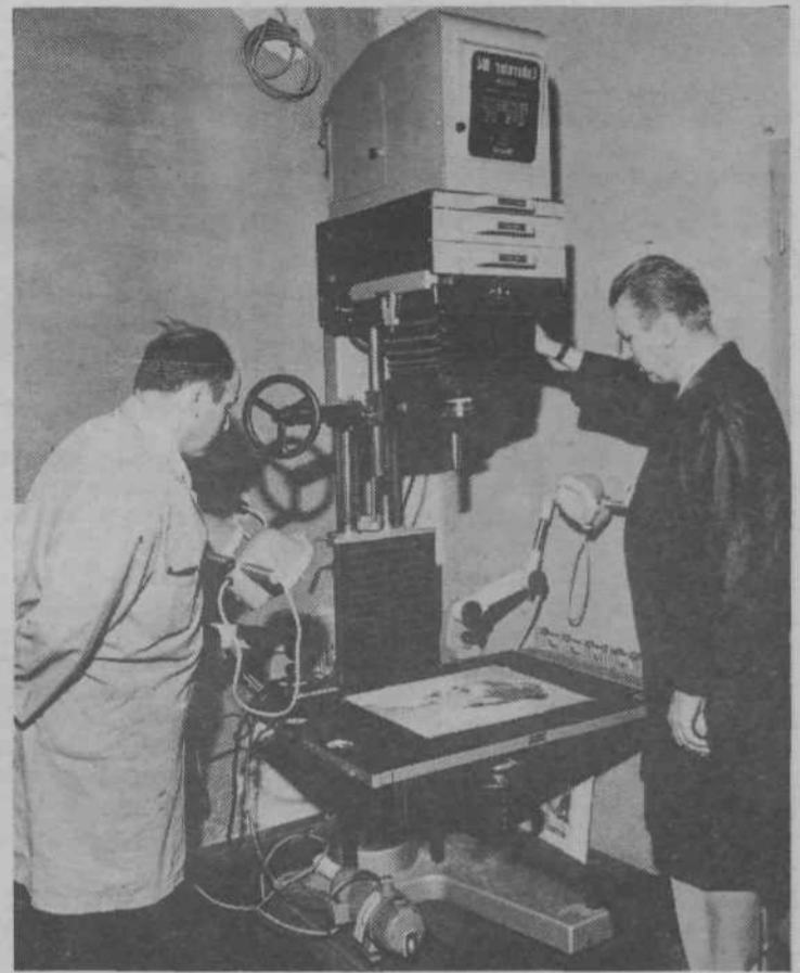
Fotooddelek litografije OZD Saturnus. (Pri fotografskem aparatu Dobrajc in Pavlič)