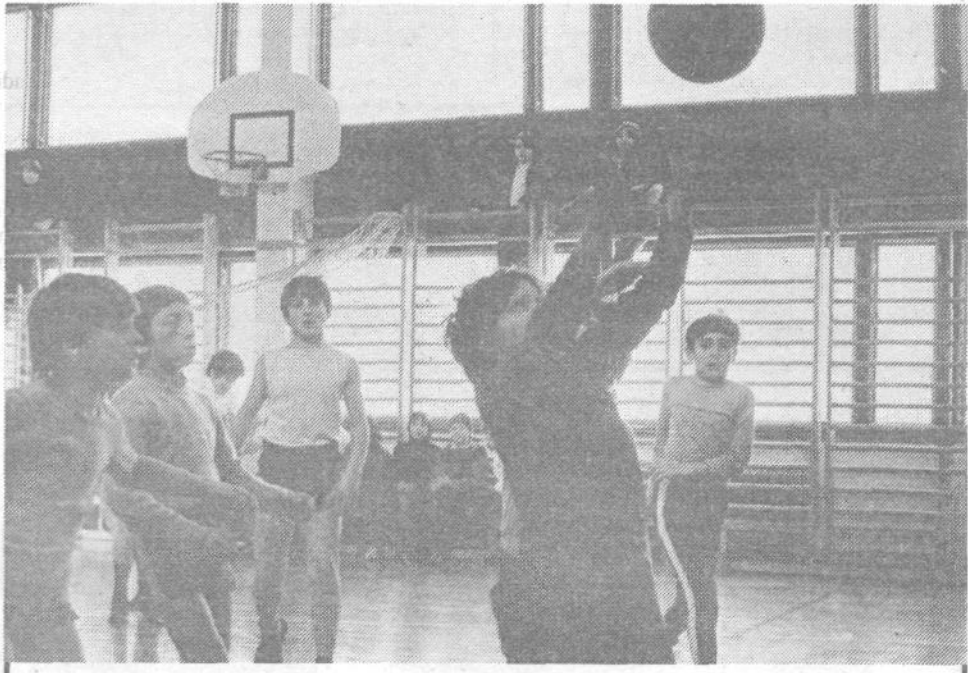
Med uro telesne vzgoje je bilo živahno, morda zato, ker pred fotoaparatom košarkarska žoga kar ni in ni hotela skozi obroč. Sicer pa je košarka le eno od veselj dobrovoških otrok. V njihovi šoli se med šolskim letom zvrsti skoraj 50 različnih krožkov, tako da se prav vsakdo lahko vključi v dejavnost, ki ga najbolj pritegne. Letos so kupili tudi dva ZX spectruma in že kar precej otrok se je spoznalo z osnovami programiranja oziroma s programskim jezikom basicom. Omeniti velja tudi pravi podvig zgodovinskega krožka, ki je - verjetno ali ne - izdal celó knjigo z naslovom »Moj kraj med NOB«, za kar so učenci prejeli nagrado višje raziskovalne skupnosti. Razvejanost vseh dejavnosti je zares izredna.