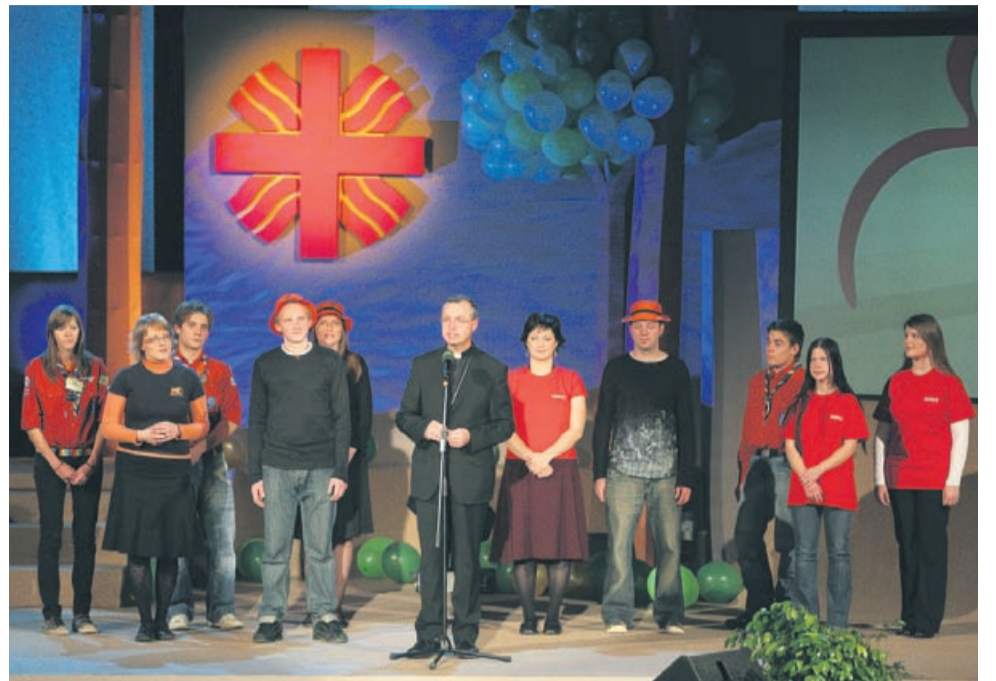
Dvorana Golovec že tradicionalno gosti tudi številne humanitarne prireditve – tudi koncert Klic dobrote, ki ga za pomoč družinam v stiski pripravlja Slovenska karitas.

Mestna občina subvencionira uporabo javnih objektov na območju ŠRC Golovec, in sicer športne dvorane Golovec v hali A, zimskega kopaljšča in kegljišča v hali B ter zunanjih površin v občinski lasti oziroma solastnini. Ob tem še uporabo športne dvorane Zlatorog z zunanjimi površinami in otroškimi igriščem, travnatega igrišča nogometnega štadiiona Arena Petrol z delom vzhodne tribune ter letnega kopaljšča in drsaljšča v mestnem parku s pripadajočimi zunanjimi površinami.