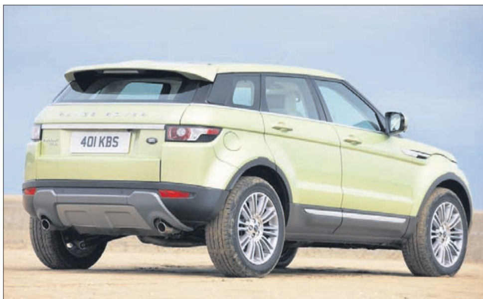
Land rover evoque