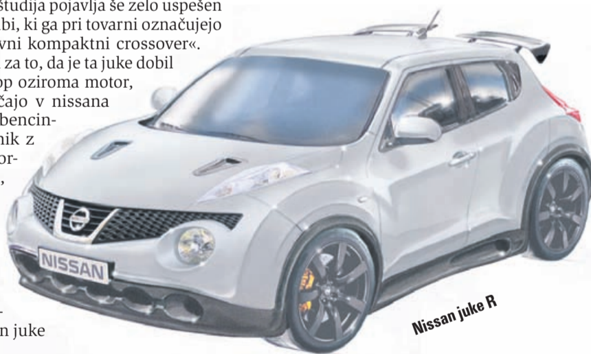
Nissan juke R