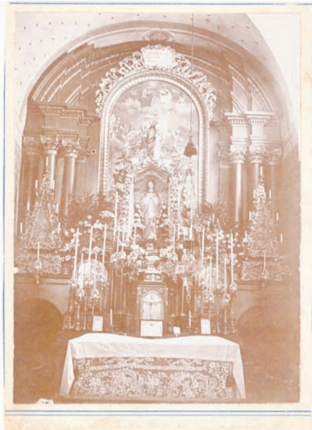
Magoličeva fotografija velikega oltarja v cerkvi sv. Cecilije v Celju

Magolič je bil izjemno plodovit, saj je fotografija zanj