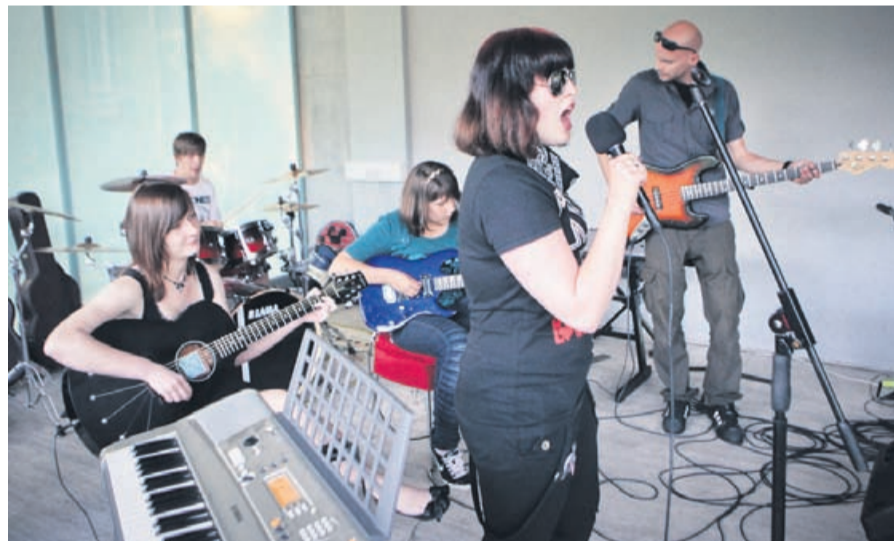
Utrinek iz skupnega nastopa učencev GVIDO v kavarni Miško Knjižko v Celju.