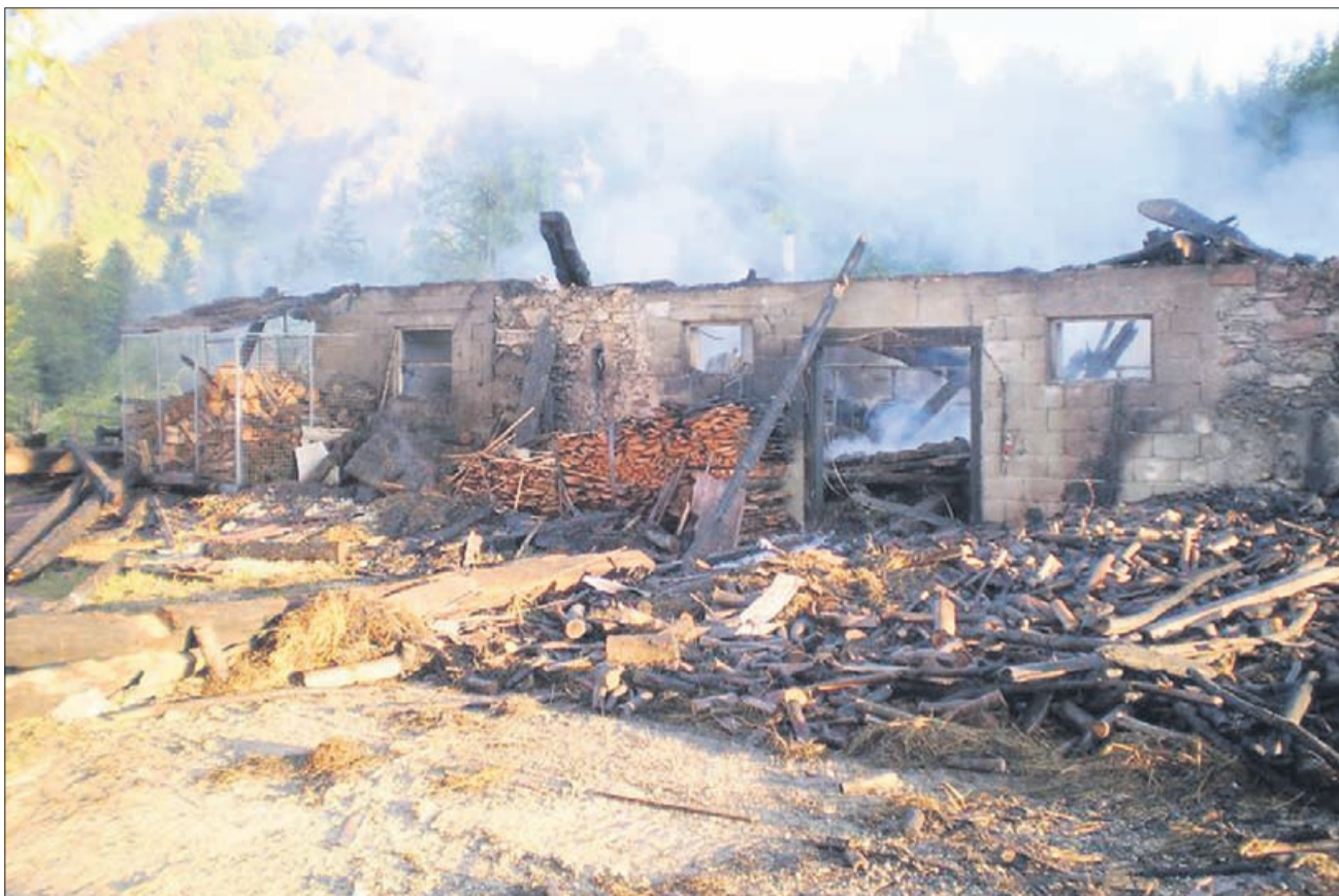
Pogorišče 3. septembra