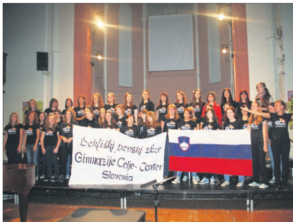
Dekliški pevski zbor Gimnazije Celje - Center se je s pevskega festivala na britanskem otoku Jersey vrnil s tremi odličji.