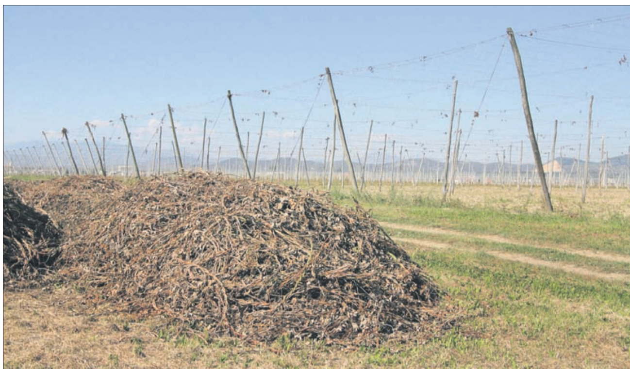
Podobnih »kupčkov« je po Spodnji Savinjski dolini kar nekaj.

»Pristojnost kmetijske inšpekcije Inšpektorata RS za kmetijstvo, gozdarstvo in hrano po tej uredbi je, da poostreno nadzira ogrožena območja, ko je razglašena velika ali zelo velika požarna ogroženost, in o nepravilnostih obvešča Inšpektorat RS za varstvo pred