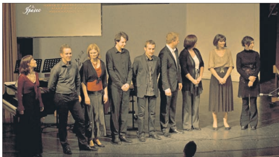
Koncert profesorjev Glasbene šole Šentjur ob izvedbi del skladateljev Ipavcev in drugih na Ipavčevih dnevih leta 2010