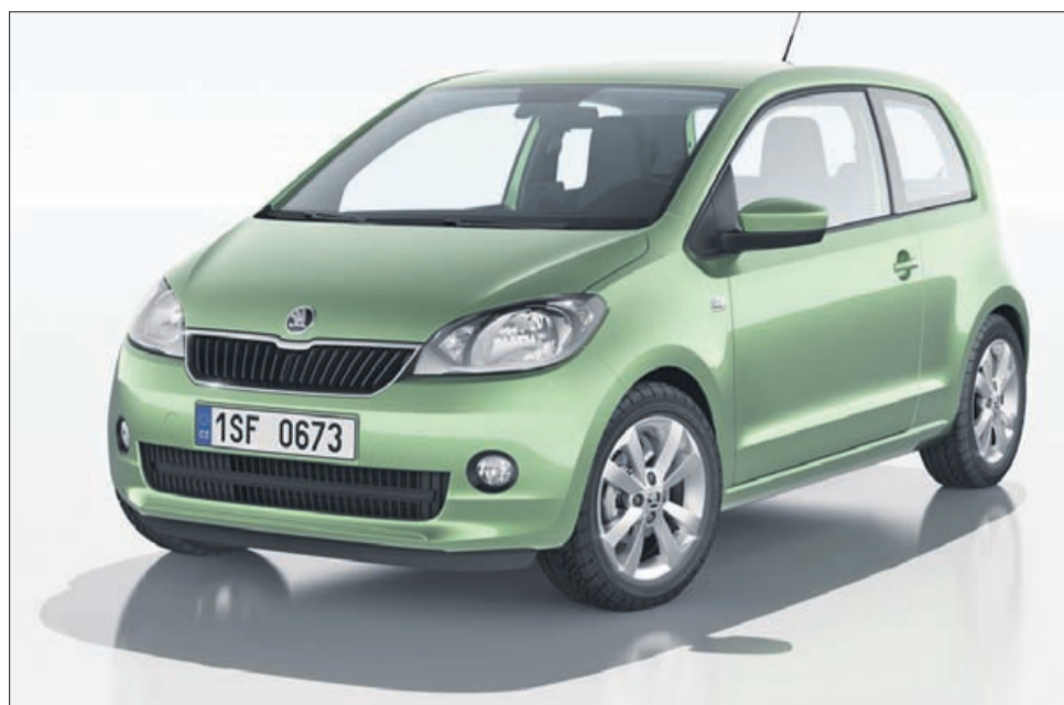
Škoda citigo, nova majhna škoda