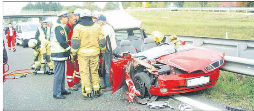
Nesreča pri avtocestnem uvozu Žalec.