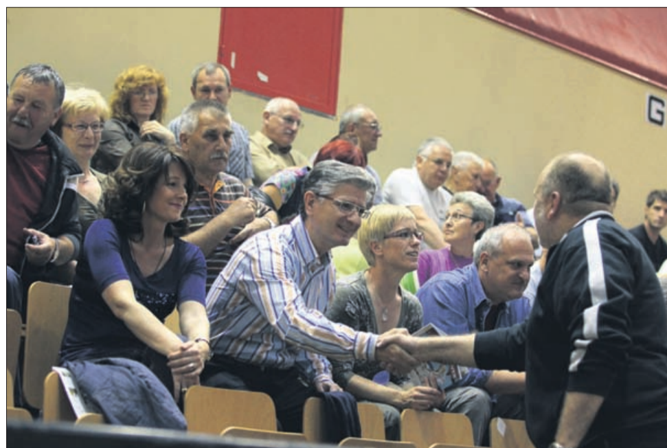
Močna velenjska naveza Bobinac-Kontič-Medved. Kako dolgo še?

Tovarna v Zaječarju je tretji Gorenjev proizvodni obrat v Srbiji, v katerem je trenutno zaposlenih 39 oseb, do konca leta pa se bo število podvojilo. Letos naj bi izdelali približno 7 tisoč umivalnikov in sestavili 7 tisoč pralnih strojev. Slednji so namenjeni prodaji v Rusiji, Ukrajini, Srbiji in na drugih vzhodnoevropskih trgih. Z naložbo v Zaječarju Gorenje krepi konkurenčnost svojih aparatov v nižjih cenovnih razredih. Gorenje je v Srbiji prisotno še s tovarnami v Valjevu in Stari Pazovi, s prodajnim podjetjem v Beogradu in z mrežo 12 lastnih razstavnoprodajnih salonov. Na vseh lokacijah v Srbiji skupaj zaposluje skoraj 1.200 ljudi.