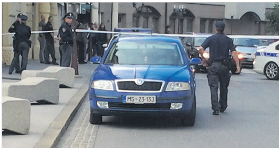
Iz Murske Sobote. V vozilu je pes, specializiran za iskanje eksploziva.

Kot je znano, je moški v sredo okoli 12.30 na Operativno komunikacijski center sporočil, da je v stavbi Mestne občine Celje podstavljena večja količina eksploziva. Policija je iz stavbe evakuirala približno 200 ljudi, od tega 120 iz objekta občine in 80 iz prostorov upravne enote. Da ljudje takšna obvestila jemljejo bolj kot ne za šalo, je kazalo to, da so v kavarni, ki je tik ob občinski stavbi, gostje mirno popivali, javni uslužbenci – tisti, ki niso odšli domov – pa so kar nekaj ur stali v bližini občinske stavbe. Kot da bi bilo tam varno, če bi res kaj