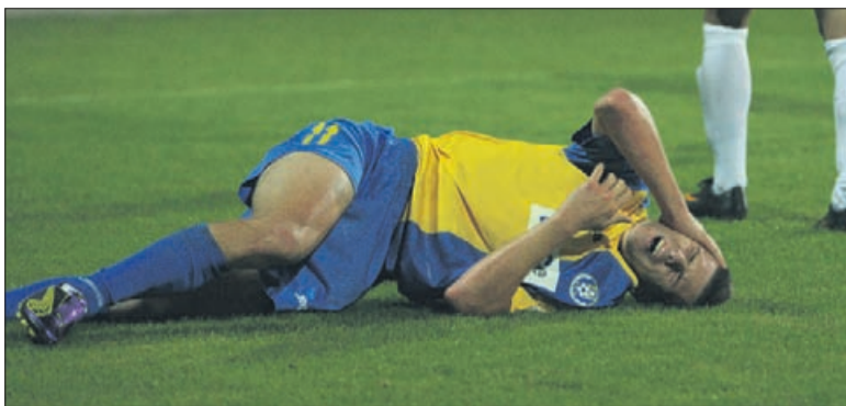
Težavam ni ne konca ne kraja.