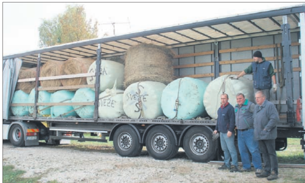
Posnetek je nastal na zbirnem mestu na Ostrožnem, kjer so naložili prvi tovornjak krme in žita.