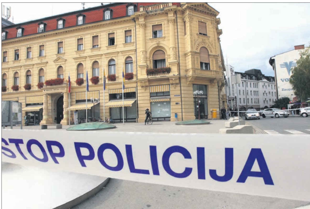
Takole so jo zagodli občinarjem ...