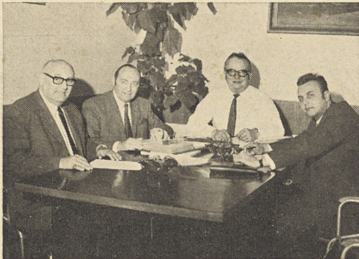
Gosta iz Švice in ZRN

Tako medsebojno zaupanje je vsekakor plod dobrih poslovnih odnosov iz prejšnjih let.