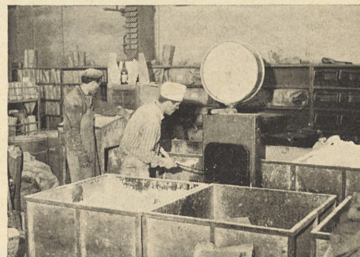
Tehtanje surovin po recepturah v sestavljalnici