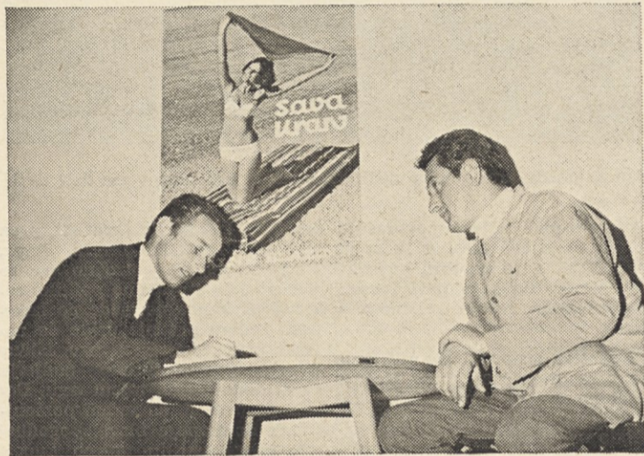
Dogovor v prodajni službi: kupec in prodajalec

Mož odgovor na težave in probleme naše trgovske mreže in posameznih prodajalnih je le delen, kajti mišljenja sem, da nima pomena detajlno razlagati in odgovarjati za vsak izdelek ločeno.