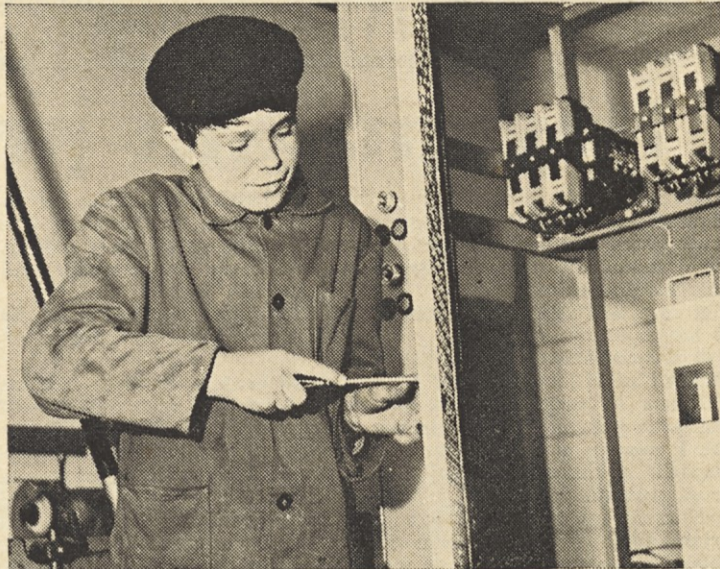
Mladini več možnosti, da se uveljavi

● Naše delo mora temeljiti na do sedaj ni najboljše. Če bomo načelu, da se osnovna dejavnost vsaj delno rešili nakazana vprašanja, bo tudi to sodelovanje bolj teriale in literaturo ter izvrševajučinkovito.