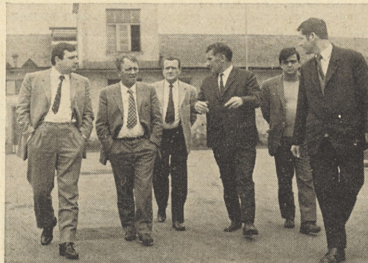
Gostje iz Italije na ogledu naše tovarne