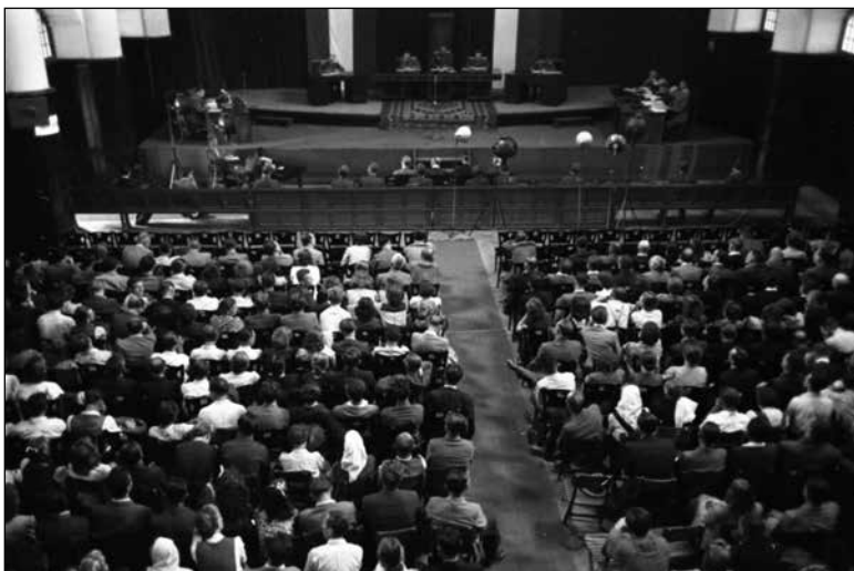
Pogled na sodno dvorano v času procesa proti Leonu Rupniku in soobtoženim. Ljubljana, 21. 8. 1946.