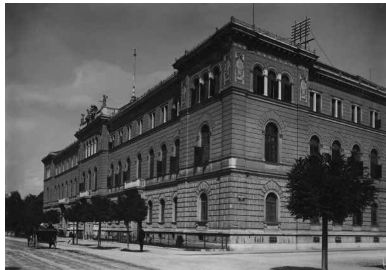
Sodna palača v Ljubljani, 1931.

razsodbe in rešitve se izrekajo in izvršujejo v imenu kralja. Natančnejše določbe je ustava vsebovala v devetem oddelku. Na čelu pravosodnega sistema je bilo t. i. Ministrstvo pravde, v pristojnost katerega je spadala » uprava celokupnega pravosodja, razen vojaškega, kazenski in podobni zavodi, državno tožilstvo, upravna sodišča, nadzorstvo nad advokati in notarji (javnimi beležniki), mednarodno pravno občevarje, urejanje zbornika zakonov in uredb, sodelovanje v strokovnem zakonodajstvu ostalih resortov za zavarovanje pravilnega uporabljanja državnih zakonov, reguliranje in nadziranje pravnih razmerij vseh priznanih ver in vsi versko politični posli «.