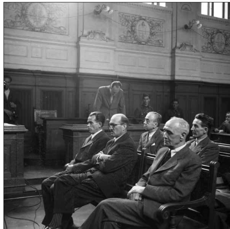
Proces proti članom Konzulte 445 pred Sodiščem narodne časti v Ljubljani, med branjem obtožnice. Ljubljana, 4. junij 1945.