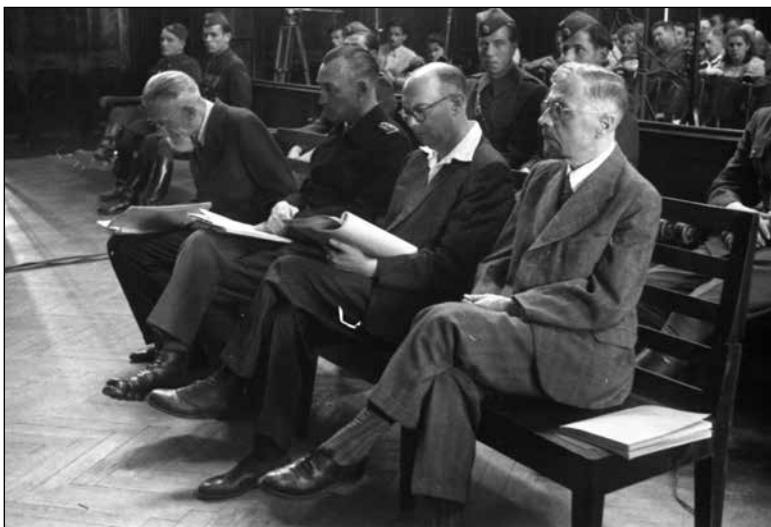
Leon Rupnik in soobtoženi pred sodiščem. Ljubljana, 21.8.1946.

kateri se bodo zagovarjali ne obtožuje samo danes živeče ljudstvo ampak tudi oni, kateri jih danes ne morejo obtoževati in to so oni, kateri počivajo pri sv. Urhu in drugod». 557 Mladina terena Hrušica-Fužine, zbrana na množičnem sestanku v Hrušici 21. avgusta 1946, je poslala resolucijo z naslednjo vsebino: »Ko je boril slovenski narod borbo za svobodo proti okupatorju, so se našli izdajalci, izvrženci slovenskega naroda, hlapci Hitlerjeve Nemčije in Mussolinijeve Italije. Ti so z vsemi grozodejstvi mučili zavedne Slovence. Slovensko zemljo pokrivajo nešteti grobovi, slovenska zemlja je napojena s slovensko krvjo, s krvjo slovenskih žrtev. Vse te žrtve nemo kličejo po zadoščenju. Povzročitelji teh morij pa so naši bratje po krvi, narodni izdajalci.« 558 Vaški odbor Klopce je poslal resolucijo, v kateri so mdr. zapisali: »Zaupamo v naše nepristransko sodišče, da bo vse slovenske izdajalce dobilo