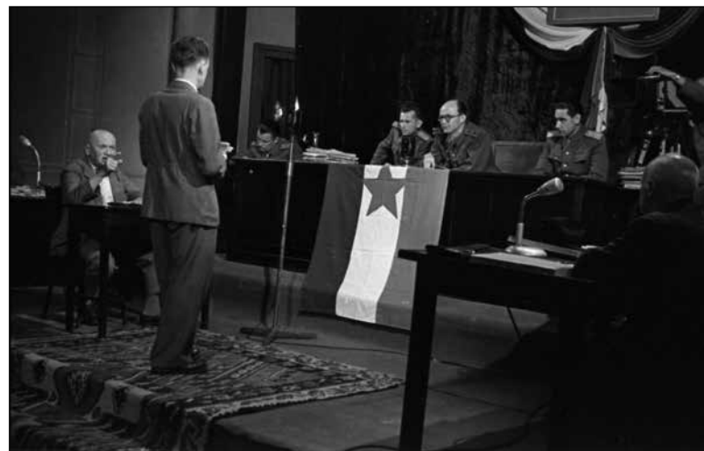
Drugi dan sodne razprave, zaslišanje Friedricha Rainerja. Ljubljana, 11. 7. 1947.

deportacij v koncentracijska taborišča ter požigov številnih vasi in krajev. Obtoženi so bili izdajanja ukazov oz. neposrednega sodelovanja pri pobojih ujetih borcev NOG in civilistov, streljanja in obešanja talcev oz. vsakogar, ki je na kakršenkoli način pomagal NOB-ju. Prav tako so bili obtoženi netenja bratomorne vojne in razbijanja » borbene enotnosti slovenskega naroda «. Skratka, bili so obtoženi najhujših vojnih zločinov neomejenega odločanja o življenju, smrti in usodi slovenskega prebivalstva. 491