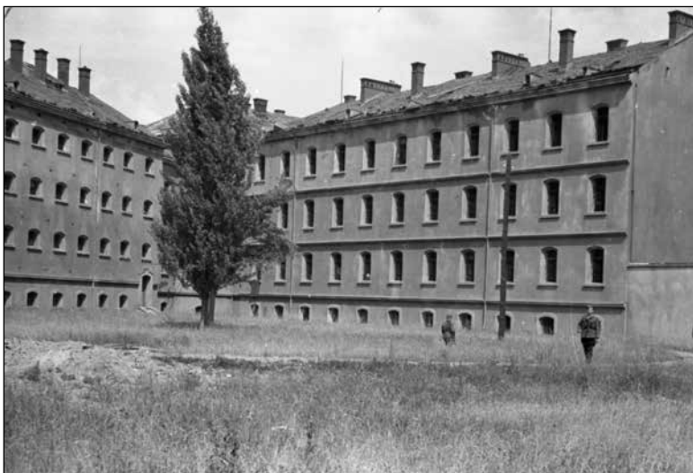
Kaznilnica v Mariboru.

Politični zaporniki so bili vojaški uporniki iz najzgodnejšega obdobja, albanski vstajniki iz takratne južne Srbije, hrvaški nacionalisti, kasneje pa nacističnih simpatizerji, vohuni ter seveda komunisti kot stalnica. V mariborsko kaznilnico so pošiljali obsojene predvsem iz Slovenije in okrožnih sodišč v Šibeniku in Splitu ter iz kaznilnic Lepoglava, Niš, Skopje, Sremska Mitrovica, Zenica, Stara Gradiška in Požarevac. Število političnih zapornikov je po uvedbi Aleksandrove diktature bistveno naraslo, kar je jasen pokazatelj povečane politične represije. 111