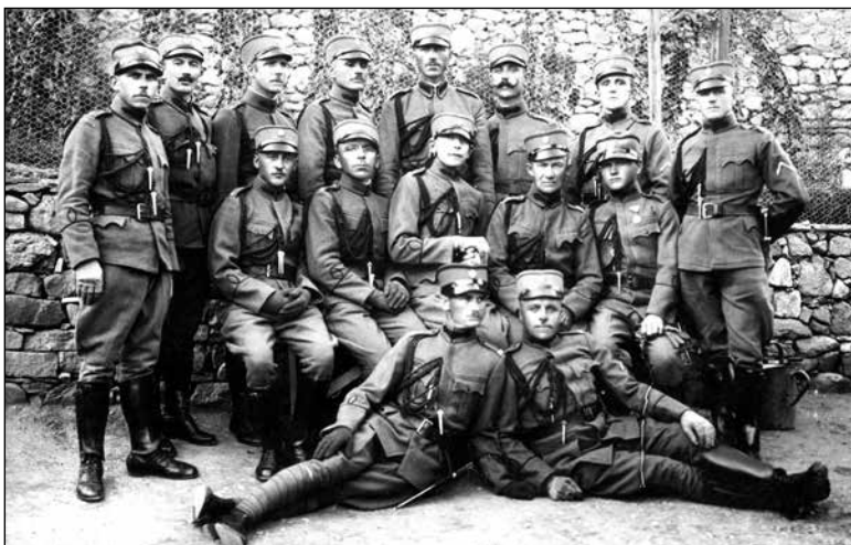
Skupinski portret orožnikov v uniformah, 1928.

Na območjih mestnih policij in policijskih uprav je podobno funkcijo opravljalo državno policijsko stražništvo. V tridesetih letih so v Dravski banovini obstajali: Uprava policije v Ljubljani s policijskimi stražnicami, predstojništva mestne policije v Celju, Mariboru in Kranju, policijski komisariat Jesenice ter železniška in obmejna komisariata v Mariboru in Rakeku. Zakon o državnih policijskih izvršilnih uslužbencih 98 je v prvem členu določal, da opravljajo »policijsko izvršilno službo posebni policijski organi kot uslužbenci resorja ministrstva za notranje zadeve«. Številčna moč stražniškega osebja v Dravski banovini se je gibala med 300 in 400 zaposlenimi.