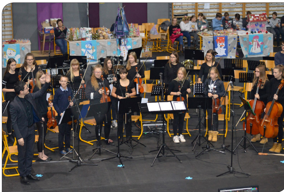
Nastop šolskega godalnega orkestra na novoletni tržnici OŠ Zreče, 29. 11. 2018