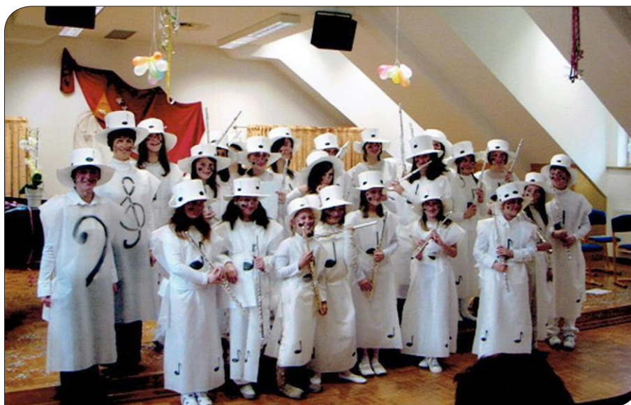
Pustni nastop v novi veliki dvorani glasbene šole, 2. 2. 2008