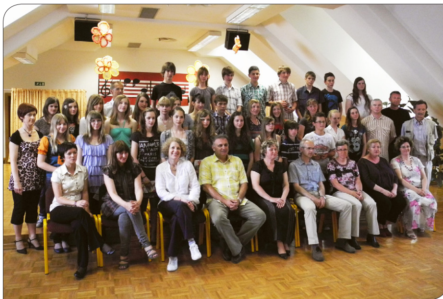
Utrinek z absolventskega nastopa, učenci in učitelji, 26. 5. 2011