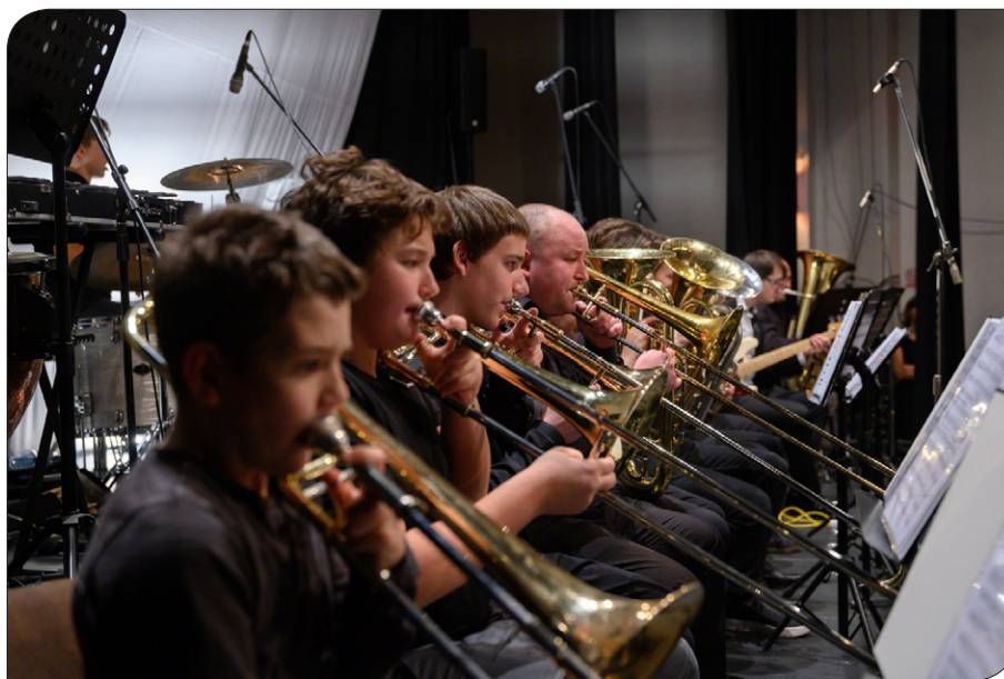
Trobilna sekcija pihalnega orkestra, božično-novoletni koncert, 20. 12. 2019