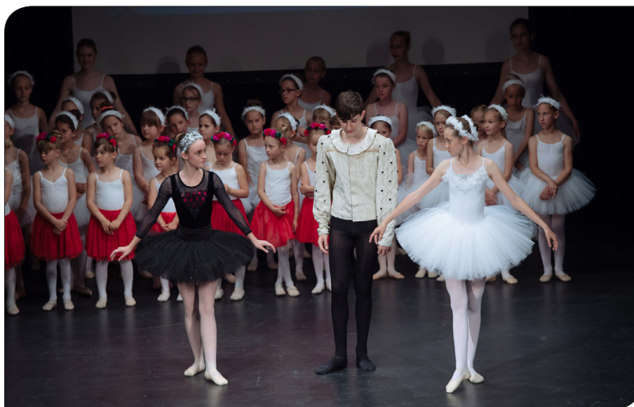
Zaključni nastop plesalcev, Labodje jezero, 7. 6. 2017