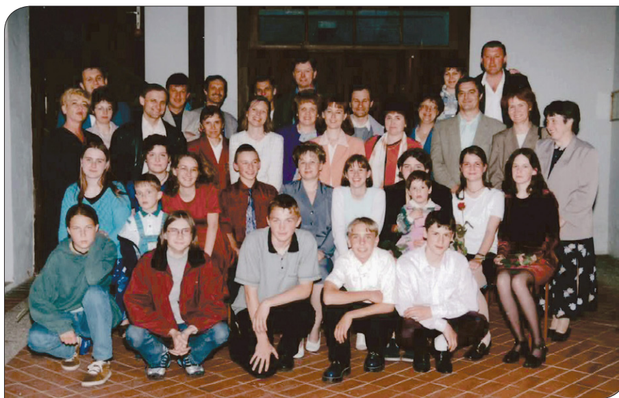
Absolventi s starši in učitelji, dvorišče glasbene šole v starem mestnem jedru, 1998