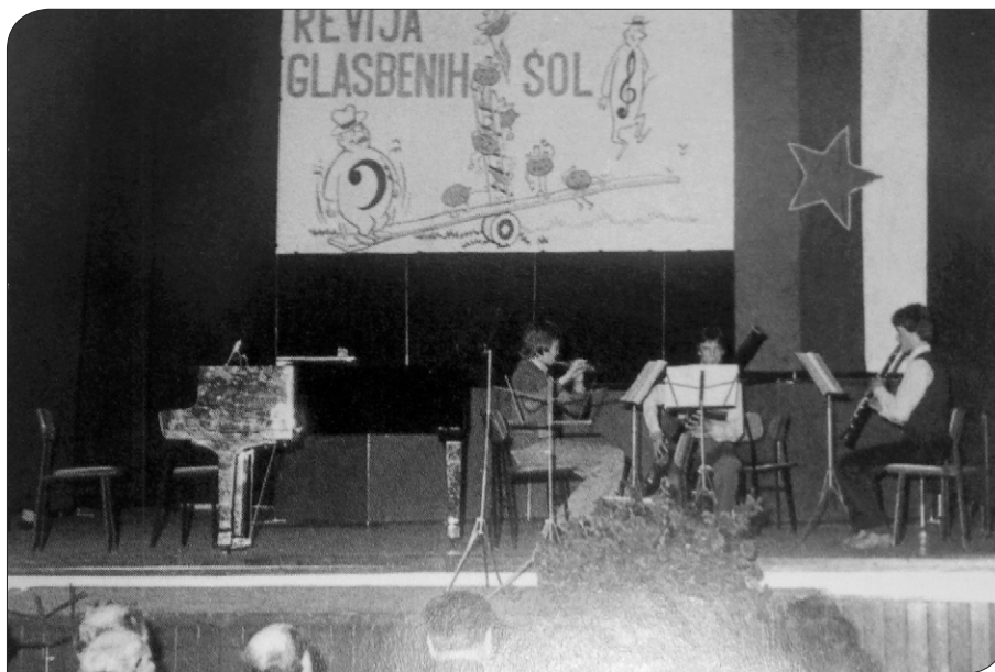
V šolskem letu 1980/81 smo bili organizator revije glasbenih šol celjske regije.