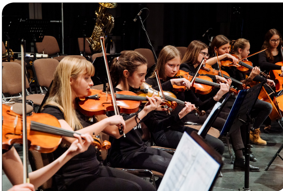
Nastop godalnega orkestra, novoletni koncert šolskih orkestrov, 21. 12. 2018