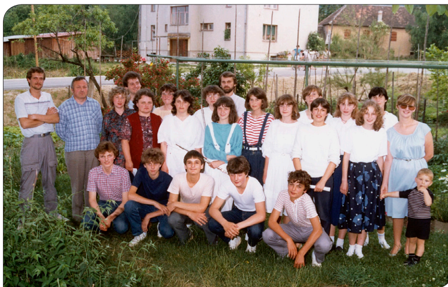
Absolventi in učitelji Glasbene šole Slovenske Konjice na dvorišču, 1985