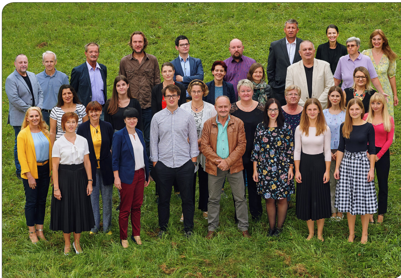
Kolektiv Glasbene šole Slovenske Konjice