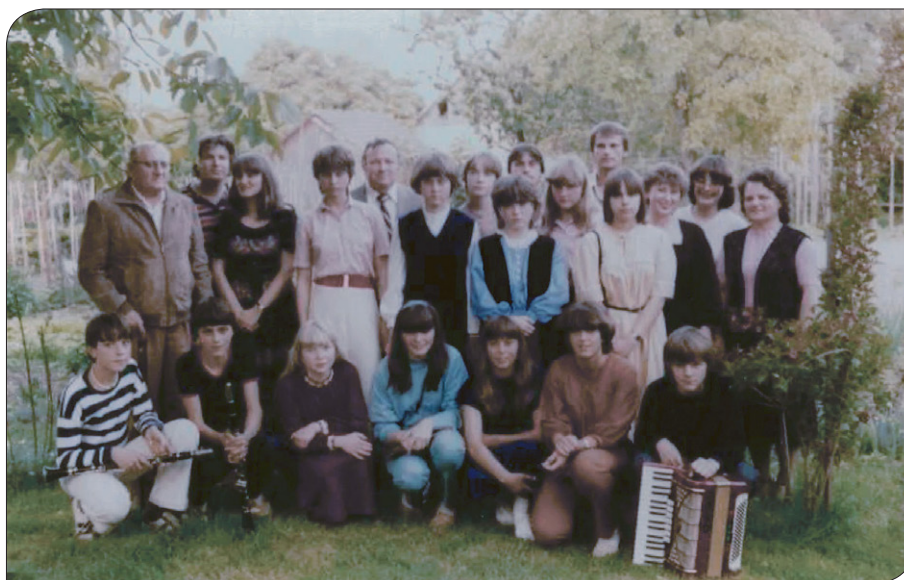
Absolventi in učitelji, 1982