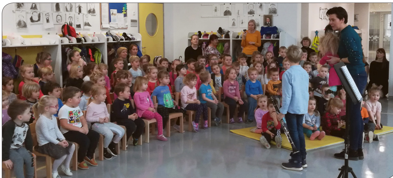
Glasbeni nastop za predšolske otroke v konjiškem vrtcu Prevrat, 11. 2. 2020