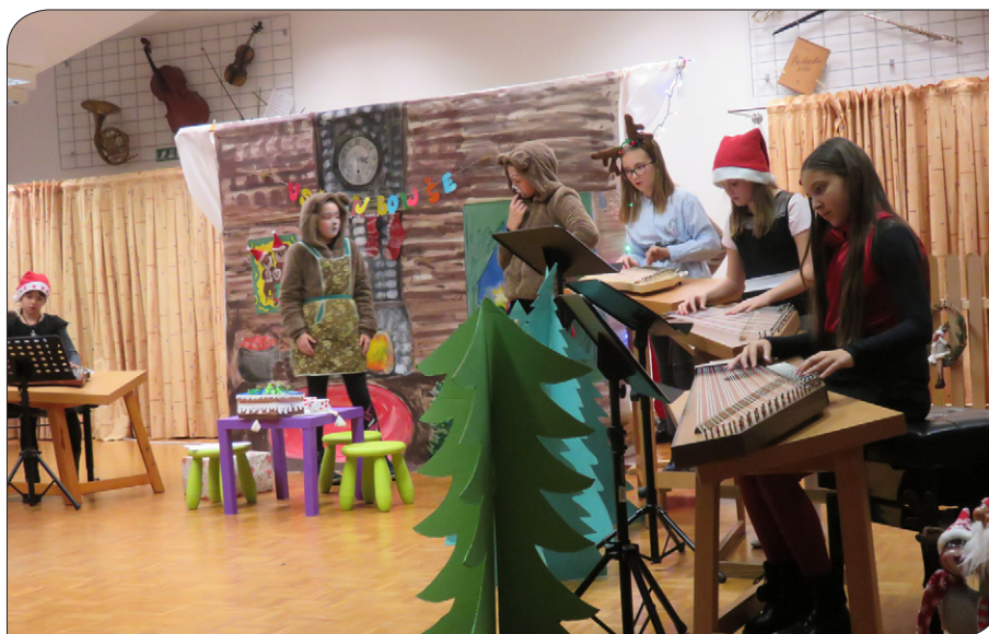
Šolska predstava učencev ceter v sodelovanju z OŠ Oplotnica, 21. 12. 2018