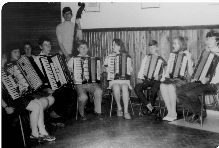
Harmonikarski orkester v šolskem letu 1971/72