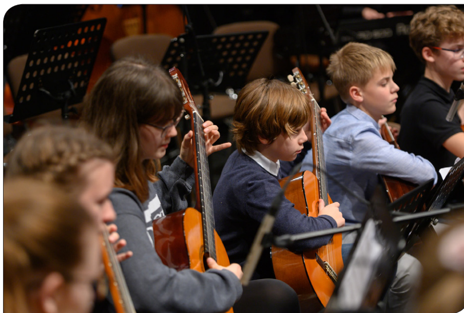
Kitarski orkester, božično-novoletni koncert, 20. 12. 2019