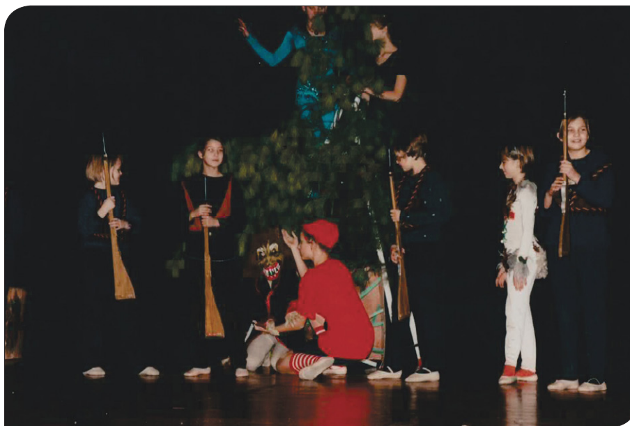
Balet Peter in volk, 1998