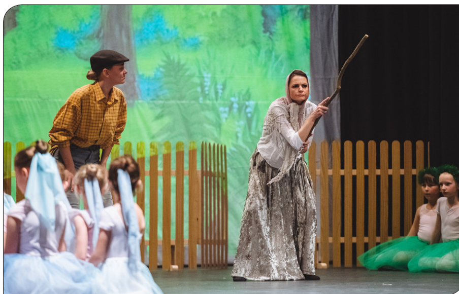
Dom kulture Slovenske Konjice, glasbena pravljica Peter in volk, 19. 12. 2018