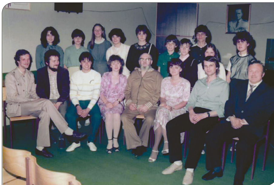
Po nastopu v učilnici nauka o glasbi, 1984