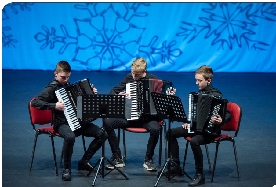
Harmonikarski trio na božično-novoletnem nastopu plesnih oddelkov glasbenih šol Slovenske Konjice in Ravne na Koroškem, 16. 12. 2019