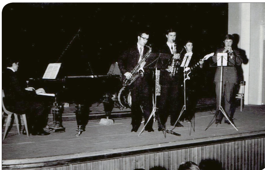
Nastop nekdanjih učencev v kulturnem domu, 1969