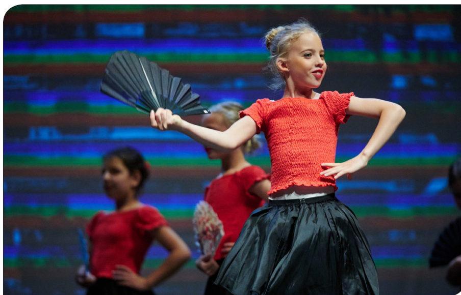
Baletna predstava Don Kihot, kulturni dom Slovenske Konjice, 5. 6. 2019