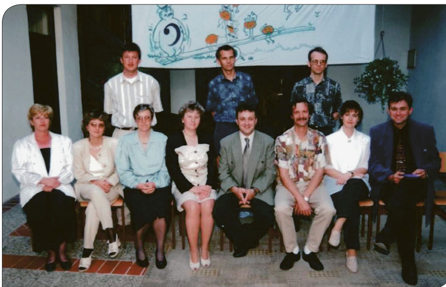
Kolektiv glasbene šole, dvorišče glasbene šole v starem mestnem jedru, 1996