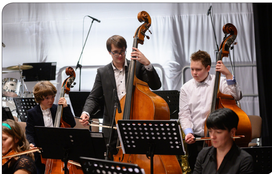
Sekcija kontrabasistov godalnega orkestra, božično-novoletni koncert šolskih orkestrrov in pevskega oddelka, 20. 12. 2019