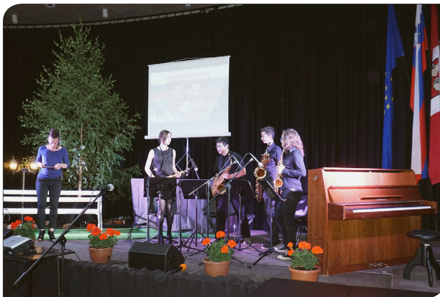
Kvartet saksofonov na nastupu v KSEVTU, Občina Vitanje, 24. 6. 2015