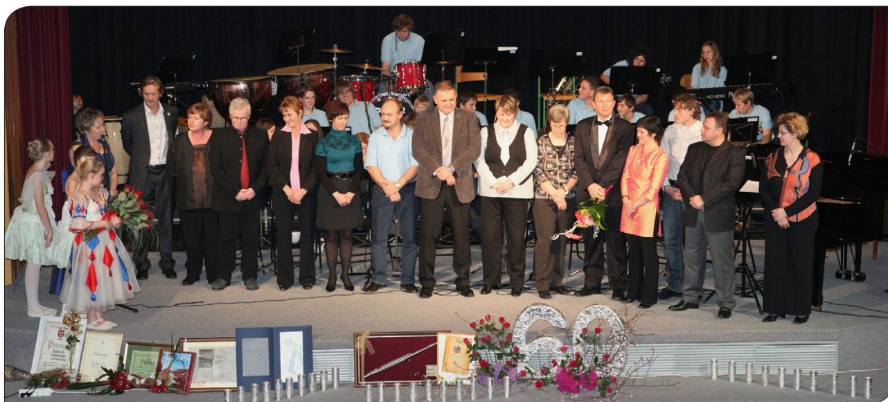
Kolektiv glasbene šole na slavnostni akademiji ob 60-letnici glasbene šole, oder kulturnega doma Slovenske Konjice, december 2010