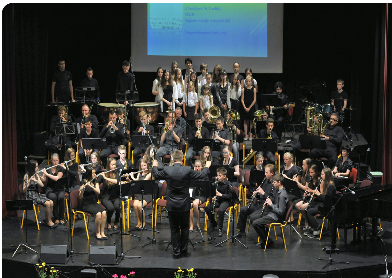
Mladinski pihalni orkester na slavnostnem koncertu ob praznovanju 65-letnice Glasbene šole Slovenske Konjice

V sodelovanju z Arnesom in MIZŠ smo pričeli sodelovati v projektu IR Optika. Nadgradnja internetne povezave nam je omogočila hitrejši prenos