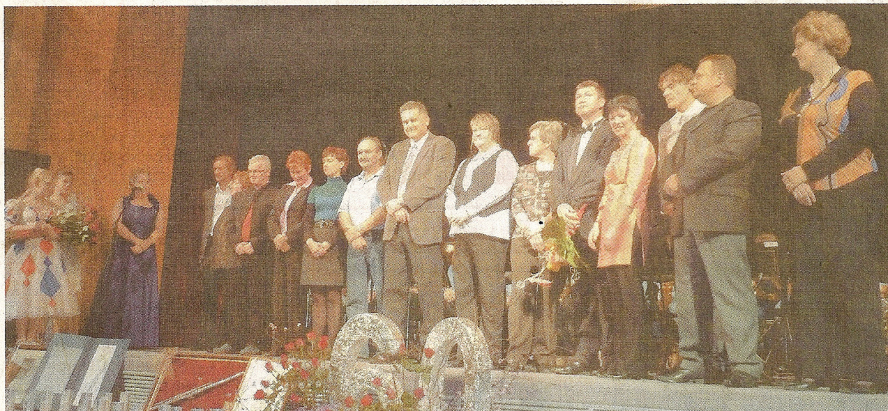
Učiteljski zbor, ki je v svet glasbe popeljal že več tisoč otrok, trenutno poučuje 348 učencev. (Rozmari Petek)