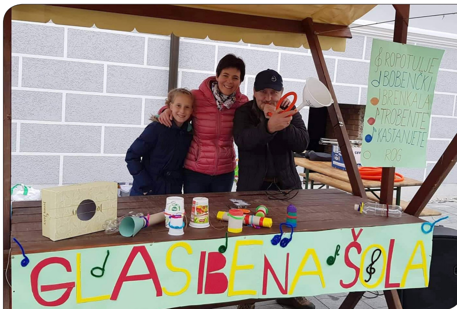
Čas je zdaj – svetovni dan Zemlje, 6. 4. 2019