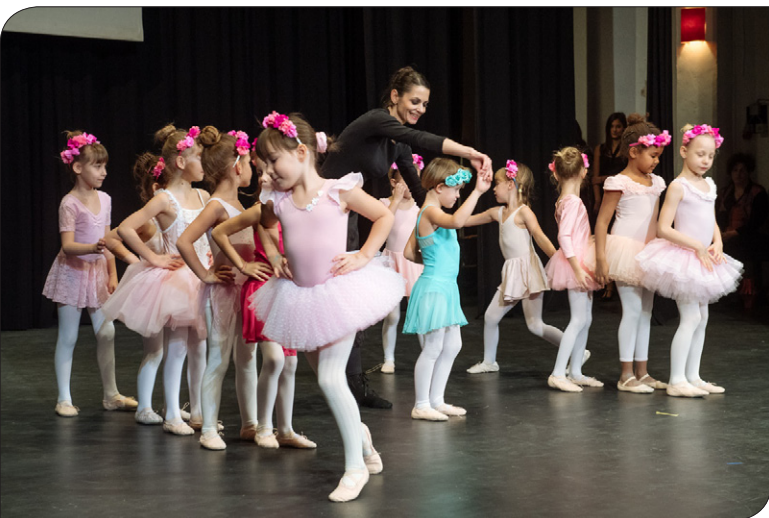
Novoletni nastop učencev plesa, komornih skupin in solistov, 22. 12. 2016