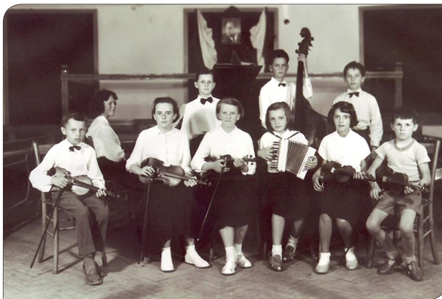
Godalni orkester učencev Glasbene šole Slovenske Konjice, 1957