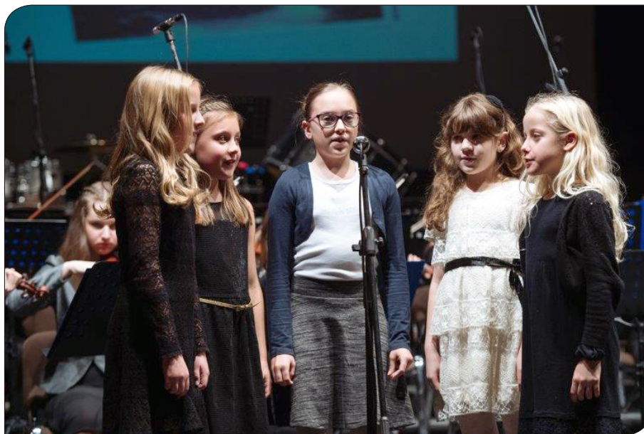
Utrinek z božično-novoletnega koncerta šolskih orkestrrov, 19. 12. 2016