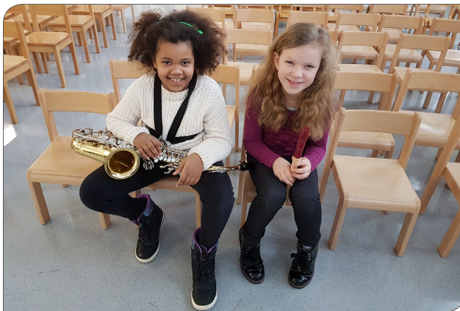
Predstavitve glasbene šole v vrtcu Slovenske Konjice, 6. 2. 2019