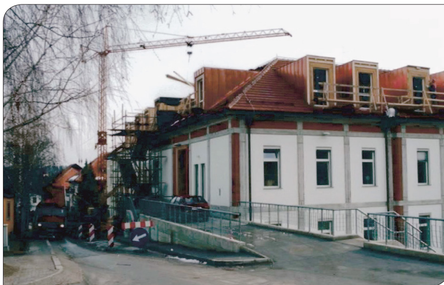
Gradnja nove šole nad OŠ Pod goro Slovenske Konjice, 2001