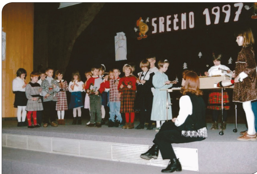
Novoletni koncert v kulturnem domu, 1996