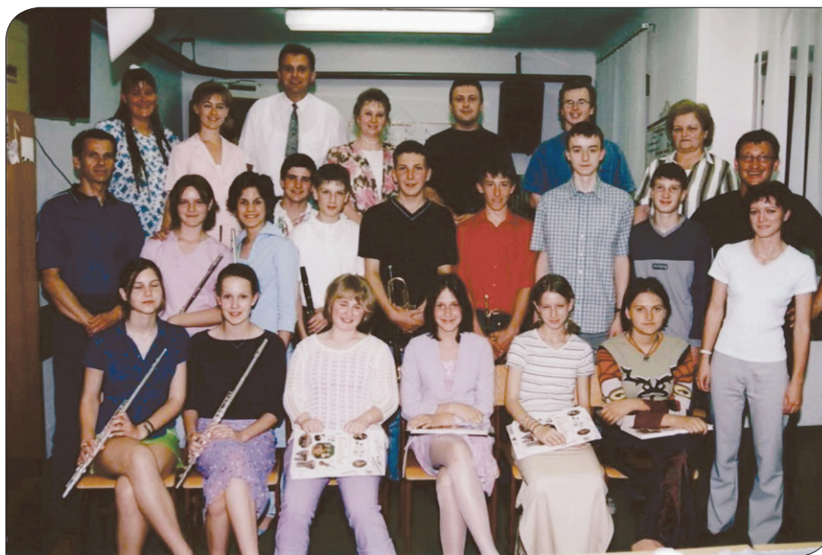
Absolventi in učitelji, 2001