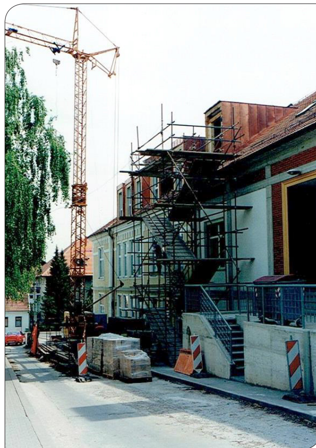
Gradnja nove glasbene šole, maj 2002