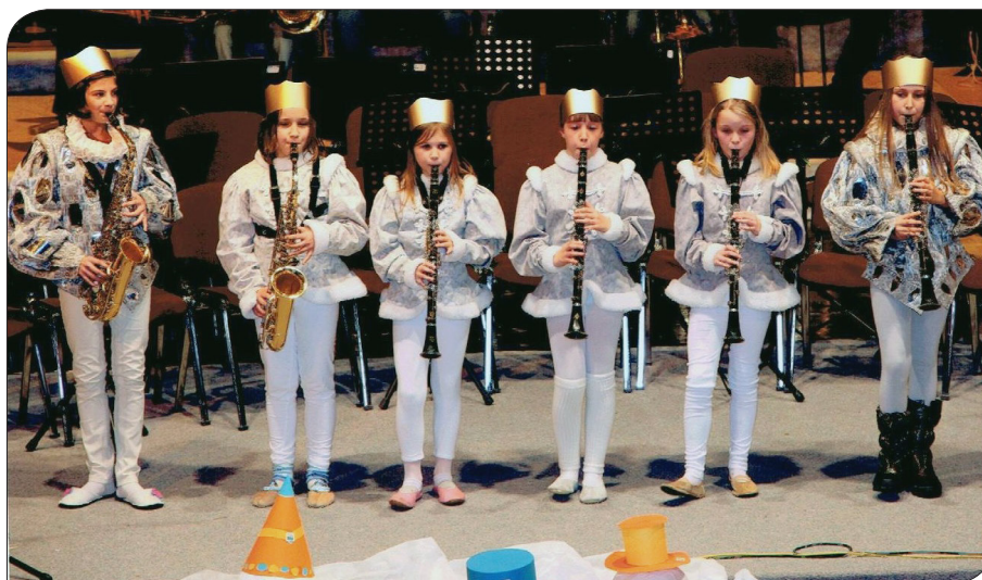
Božično-novoletni nastop, 22. 12. 2011