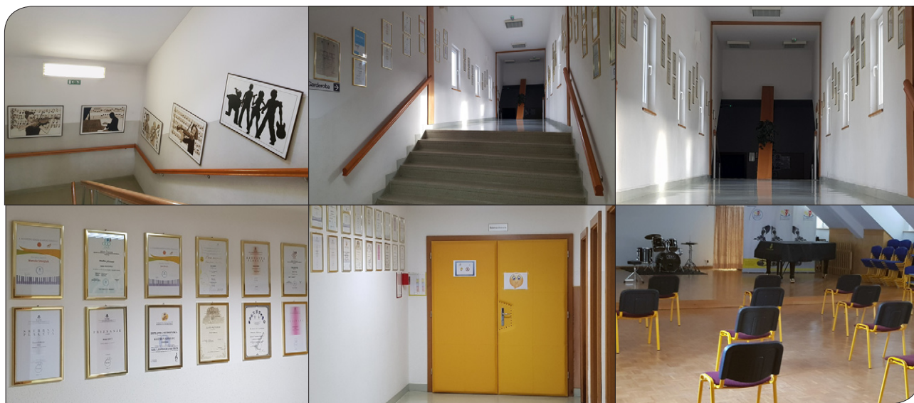
Prostori glasbene šole čakajo, da se vanje čim prej vrne otroški razigrani smeh in zvedava želja po novem znanju (čas pandemije oktober/november, 2020).