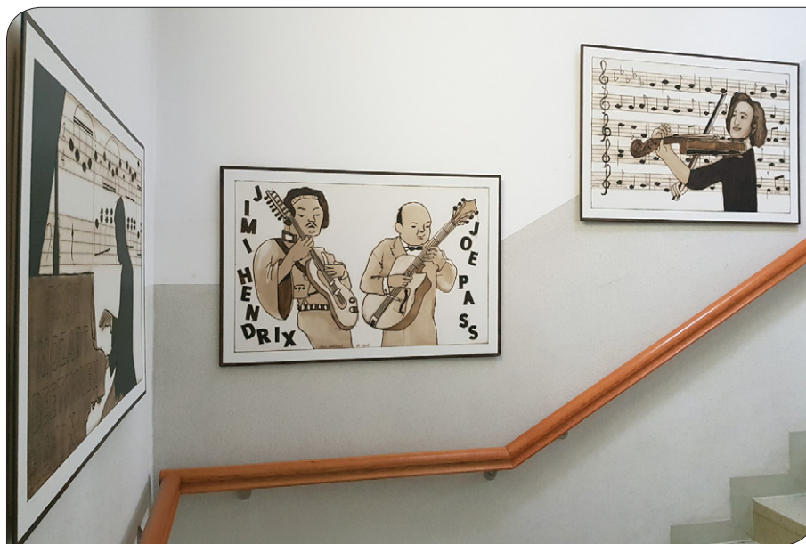
Med šolanjem na daljavo sameva tudi razstava učencev OŠ Zreče mentorja Milana Lamovca – Didija, postavljena na stopnišču glasbene šole, 2020.