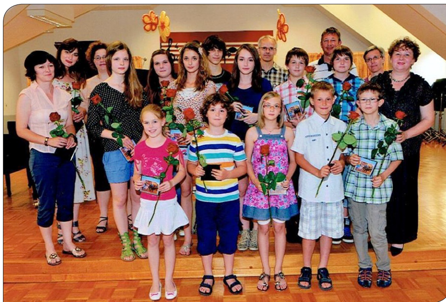
Nastop tekmovalcev v šolskem letu 2011/12, dvorana glasbene šole, 18. 6. 2012