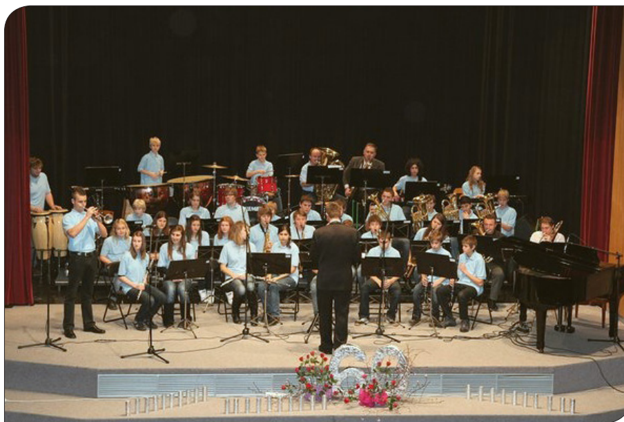
Nastop ob 60-letnici Glasbene šole Slovenske Konjice na odru kulturnega doma v Slovenskih Konjicah, december 2010