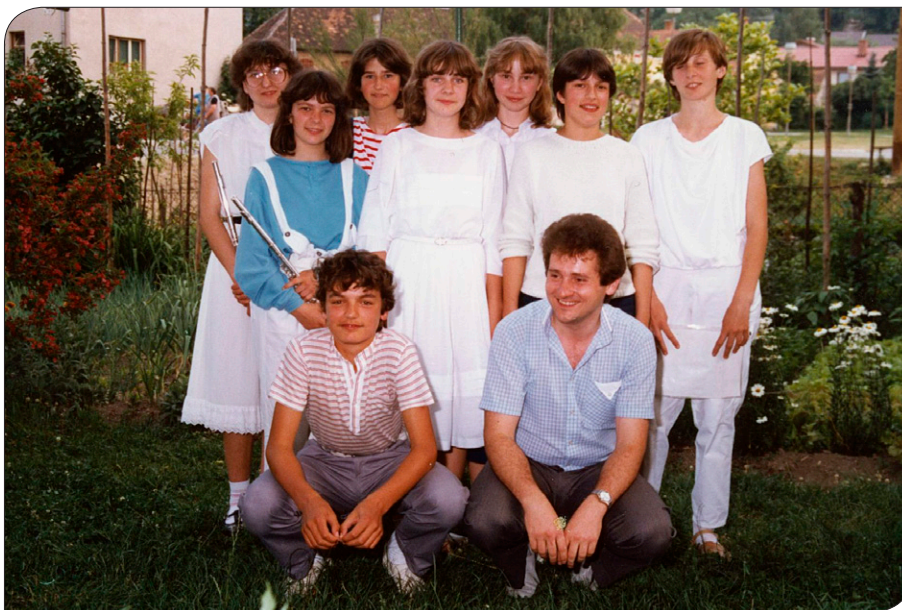
Absolventi klavirja in flavte z mentorjem, 1985