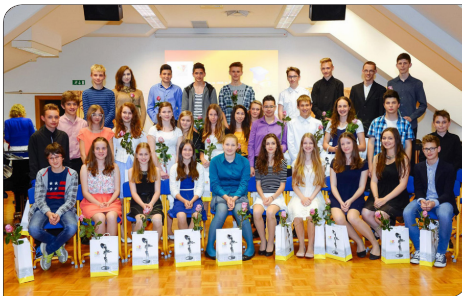
Absolventi glasbene šole v šolskem letu 2014/15 (25. 5. 2015)