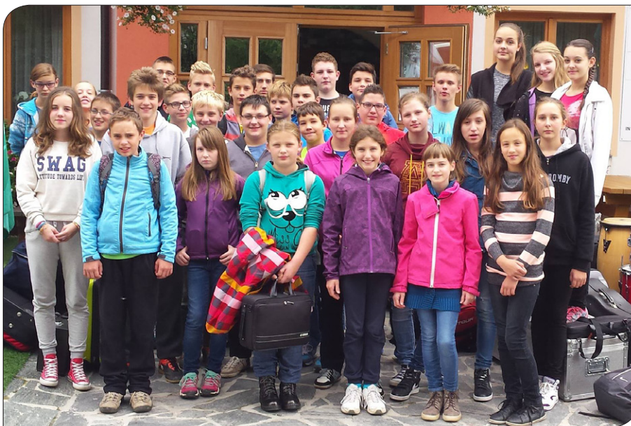
Priprave šolskega pihalnega orkestra, Trije Kralji, 2014