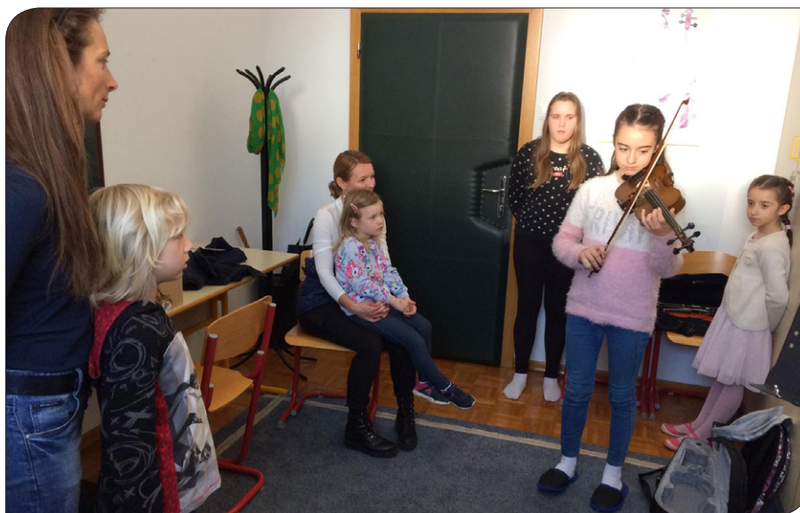
Dan odprtih vrat Glasbene šole Slovenske Konjice, 30. 3. 2019