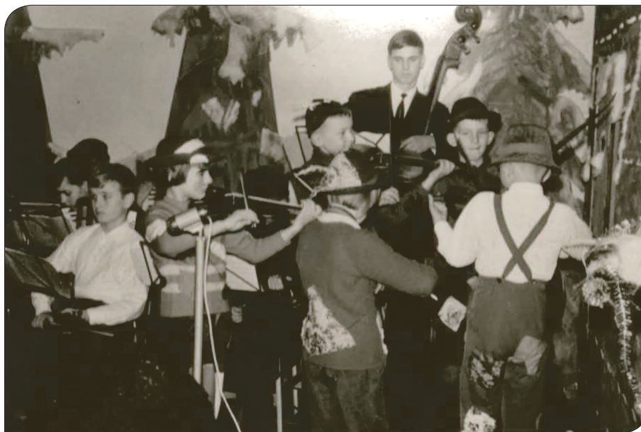
Opereta Planinska roža, 1966

GLASBENA ŠOLA SLOVENSKE KONJICE PRIREDI S SODELOVANJEM DPD " SVOBODA " IN MEŠANIM PEVSKIM ZBOROM