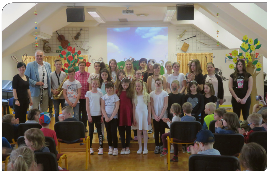
Miška si poišče nov dom, glasbena predstava za Vrtec Slovenske Konjice, 2018