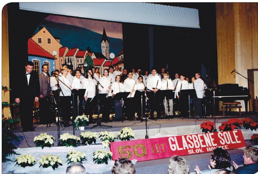
Slavnostni koncert ob 50-letnici, kulturni dom Slovenske Konjice, 2000