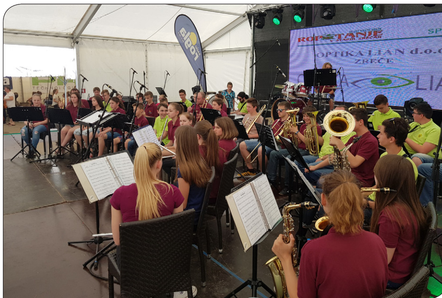
Koncert šolskega pihalnega orkestra na Ropotanju v starih Zrečah, 4. 6. 2017