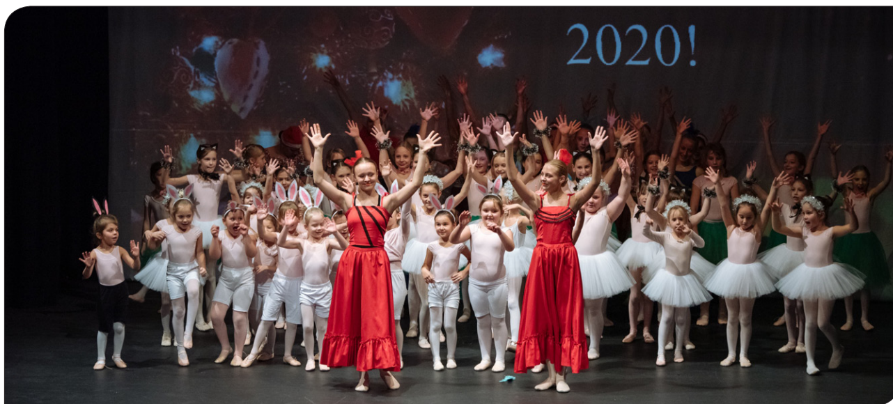
Božično-novoletni nastop plesnih oddelkov glasbenih šol Slovenske Konjice in Ravne na Koroškem, 16. 12. 2019