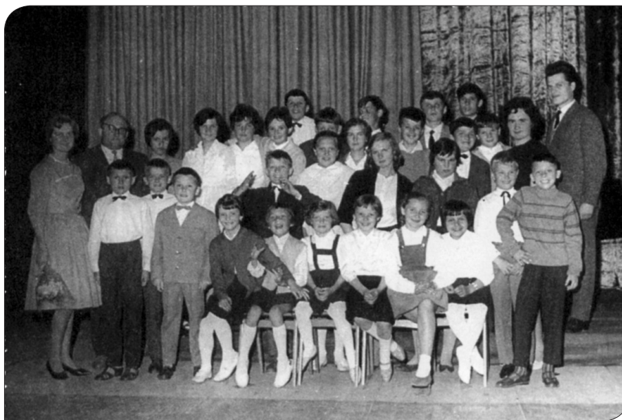
Zreče – nastop gojencev glasbene šole v šolskem letu 1966/67