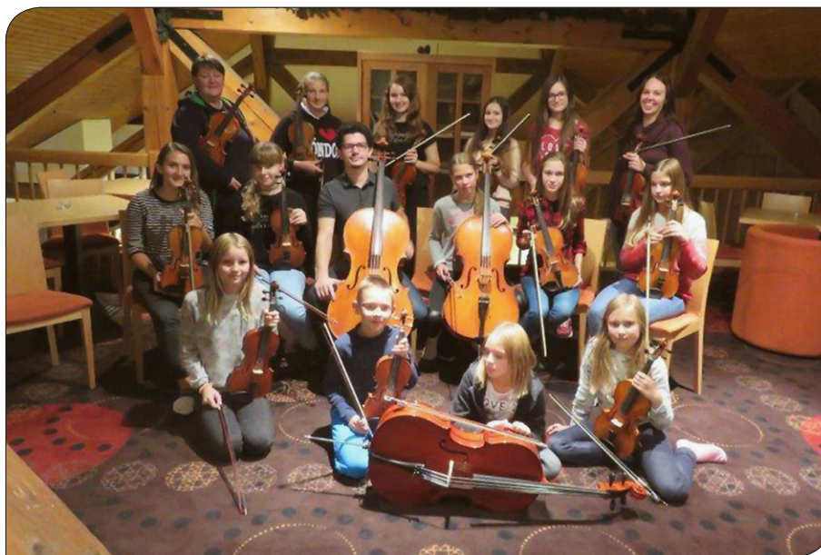
Godalni orkester, priprave na Rogli, 13. 10. 2016