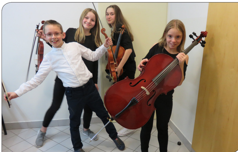
Godalni kvartet na reviji v Rogaški Slatini, 15. 3. 2017