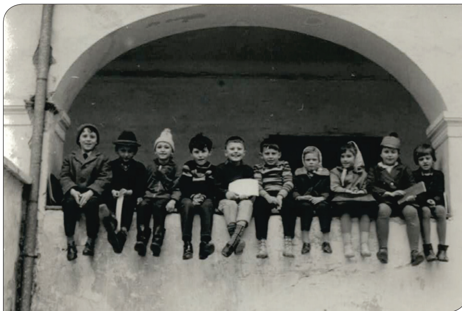
Glasbena pripravnica, Trebnik, 1964