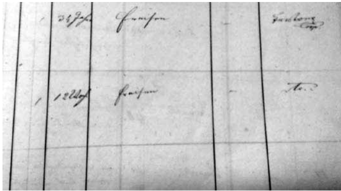
MMK Cerklje na Gorenjskem 1856–1876 (1869): pogost vzrok smrti pri dojenčkih: Fraisen.